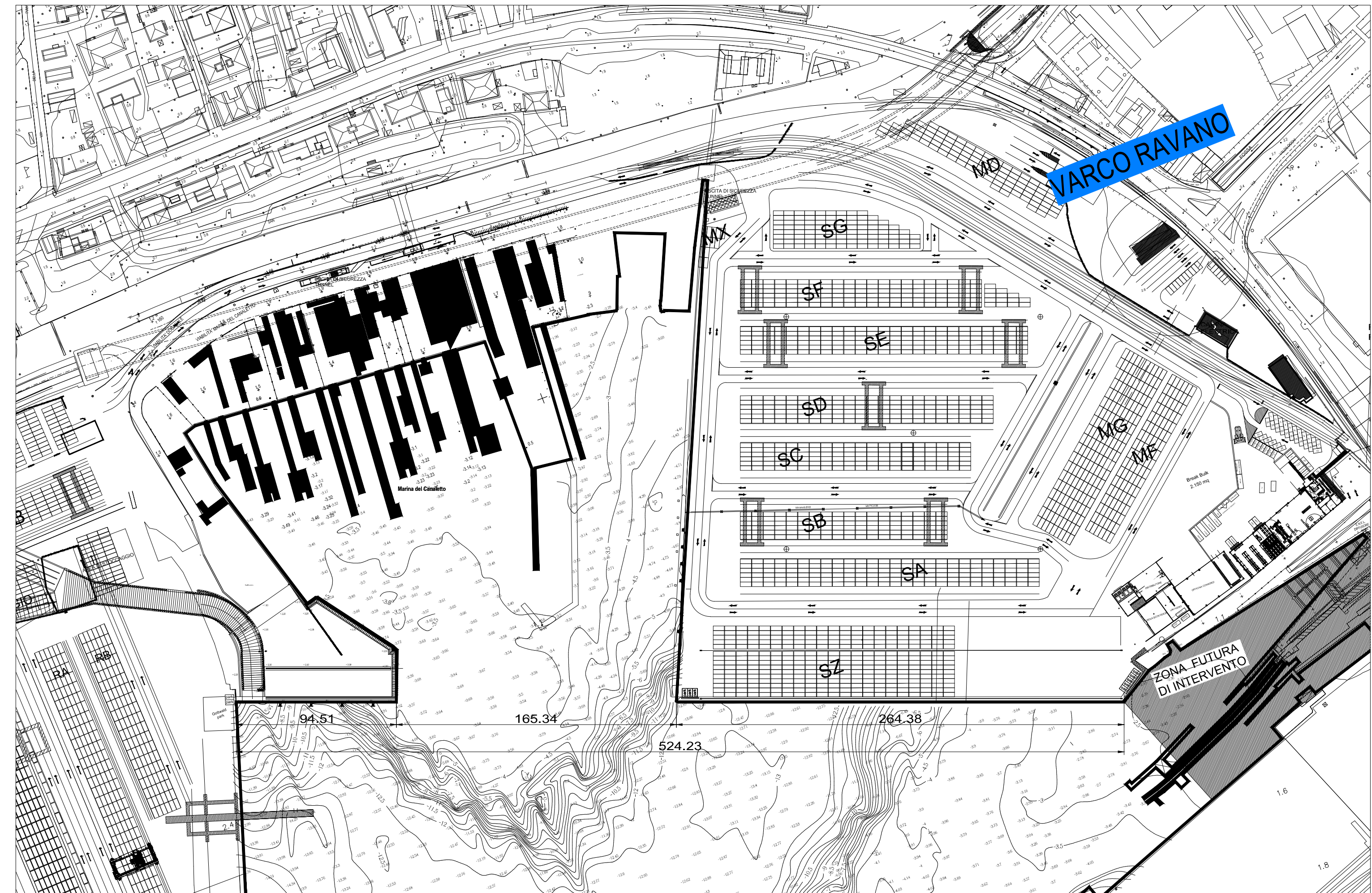
STATO ATTUALE scala 1:2000