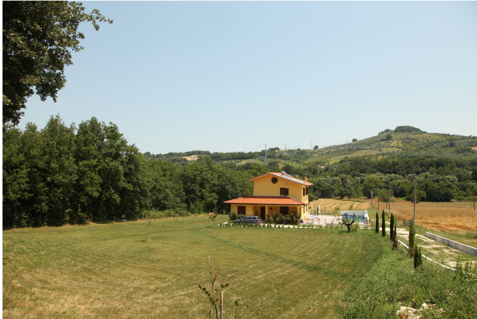
Punto di Vista A - Colore grigio