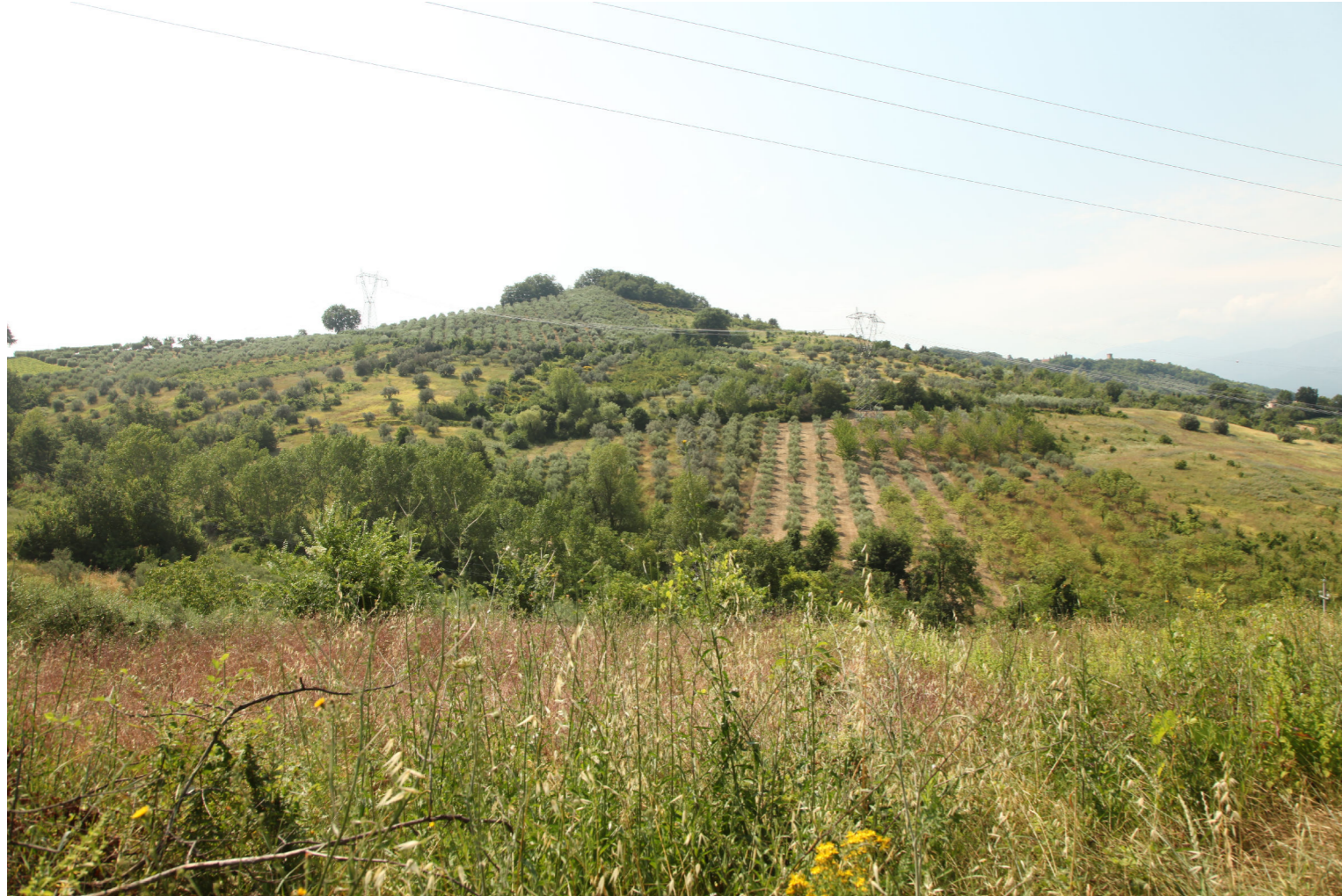
Punto di Vista B - Stato di fatto