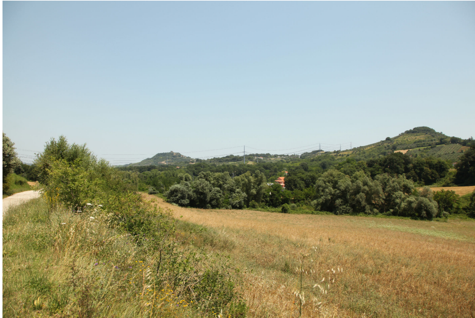
Punto di Vista C - Colore grigio