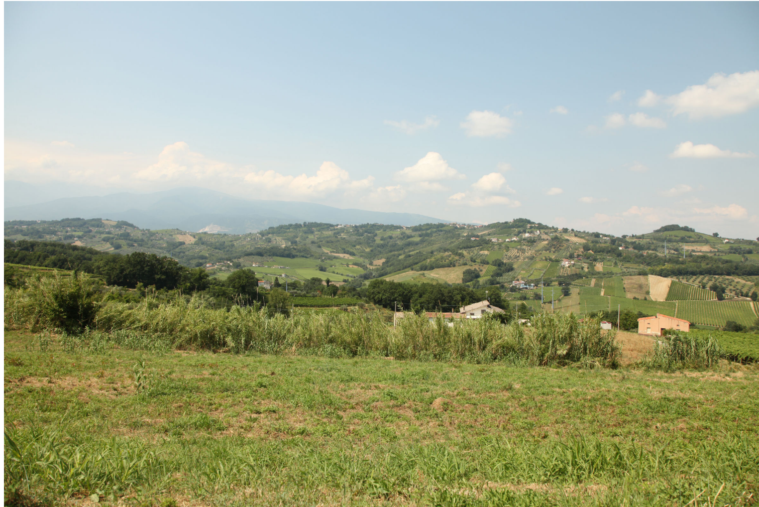
Punto di Vista D - Colore grigio