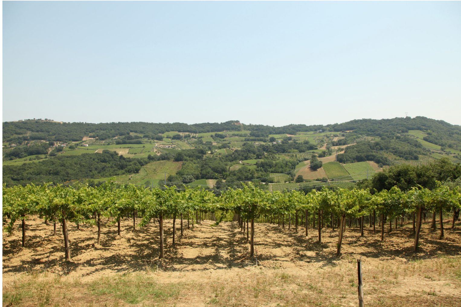
Punto di Vista E - Colore grigio