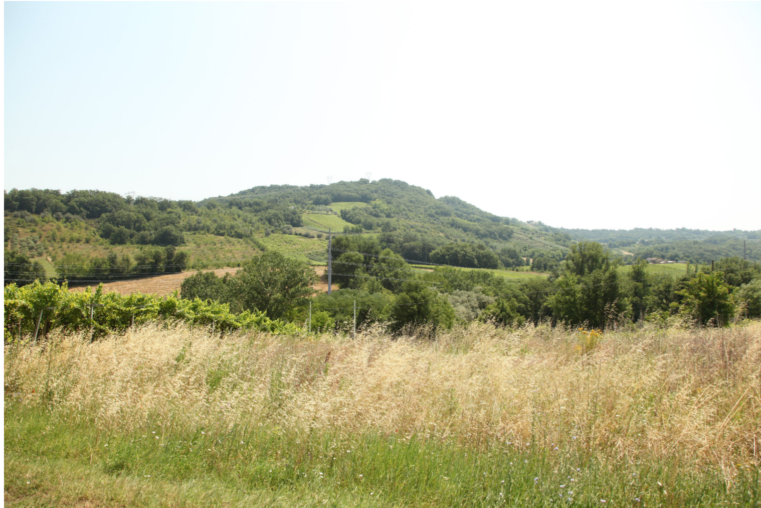
Punto di Vista F - Colore grigio