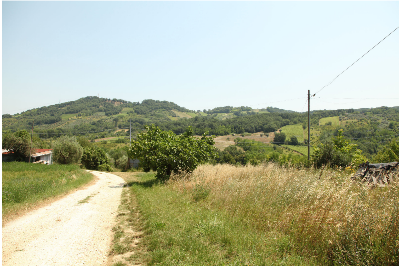
Punto di Vista G - Colore grigio