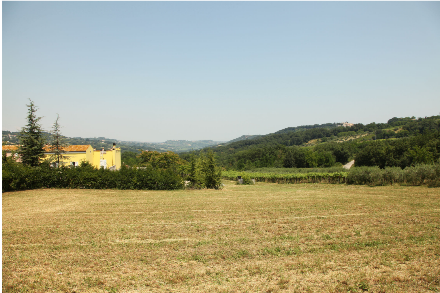
Punto di Vista H - Stato di fatto