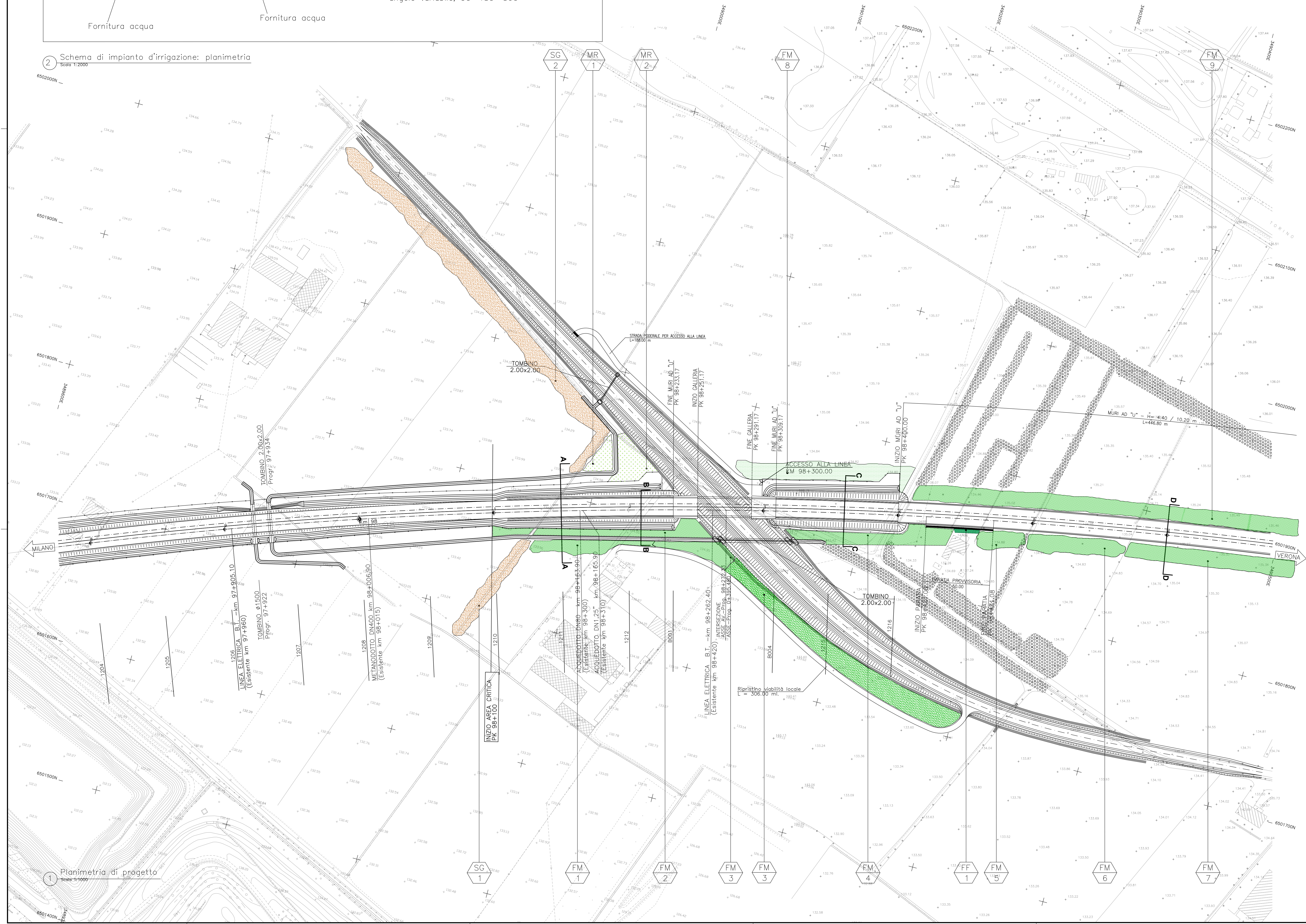
1 Planimetria di progetto Scala 1:1000