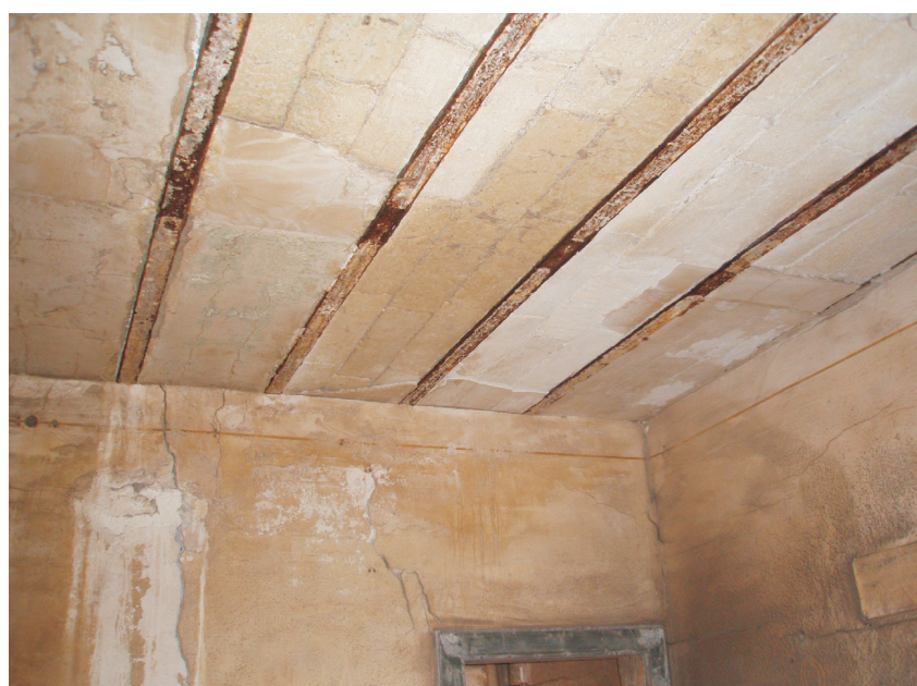
Torre Montello: stato di degrado dei solai