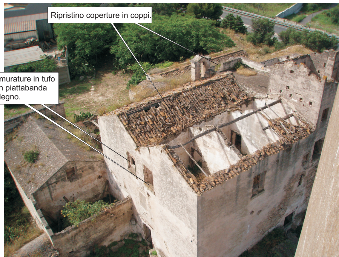
Ripristino coperture in coppi.