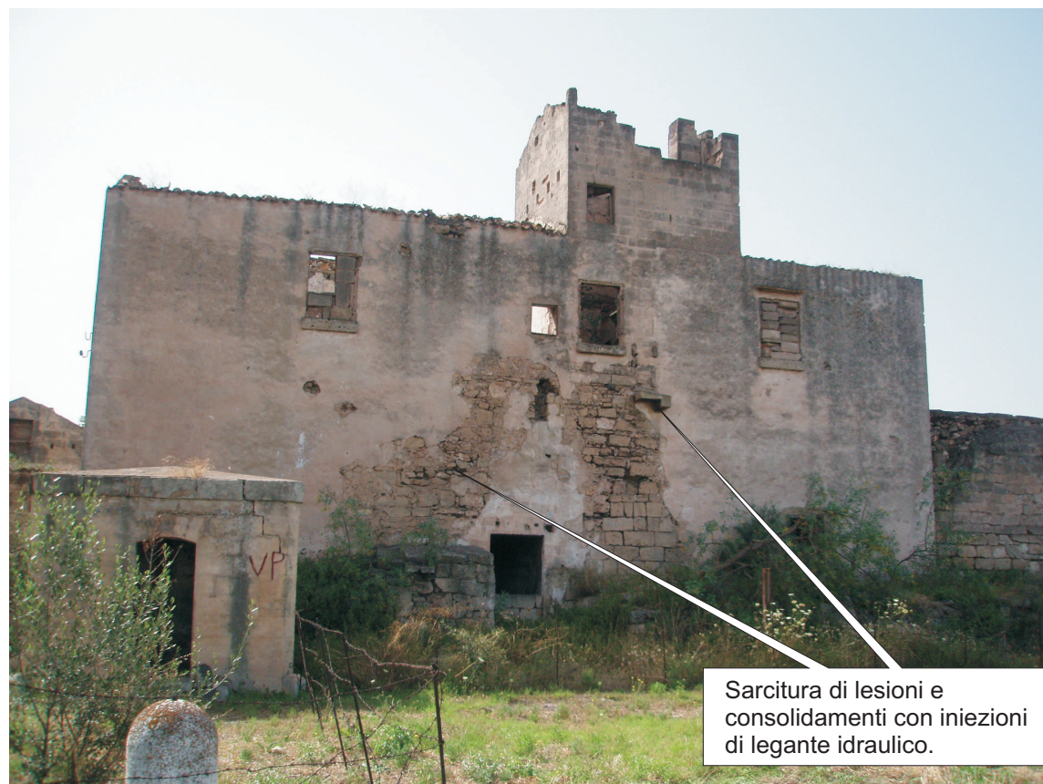
Sarcitura di lesioni e consolidamenti con iniezioni di legante idraulico.