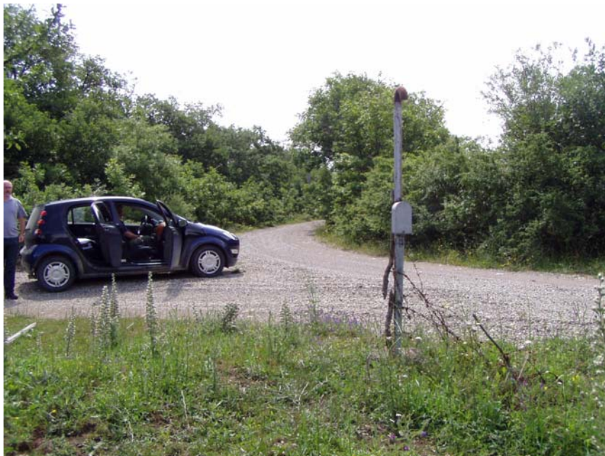
Foto 13 – Tracciato metanodotto di collegamento lungo la strada di servizio tra Gr 33-35 e Gr 36-37