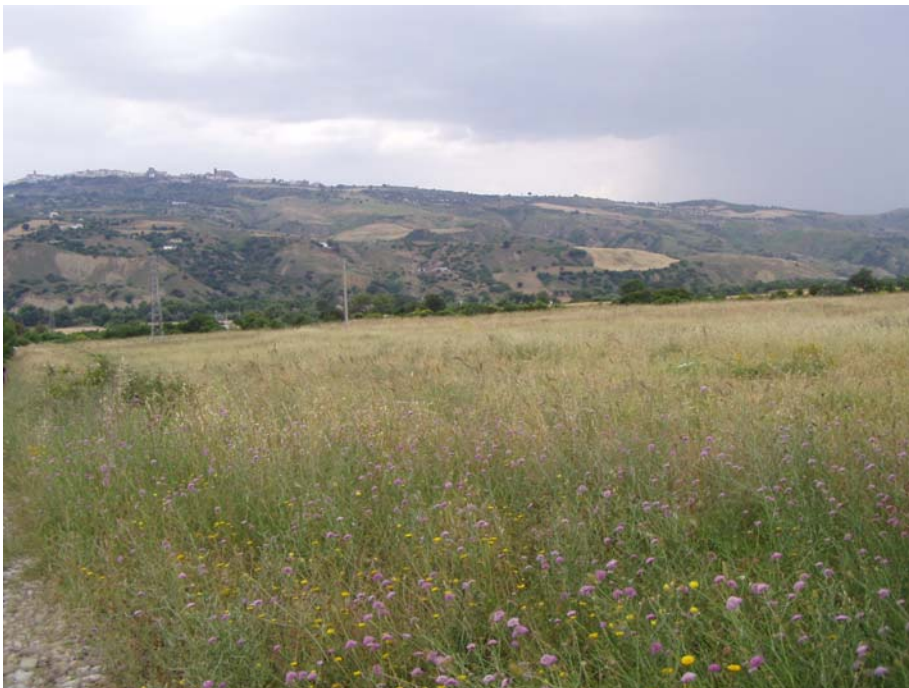
Foto 3 - Panoramica area Centrale compressione e trattamento da monte