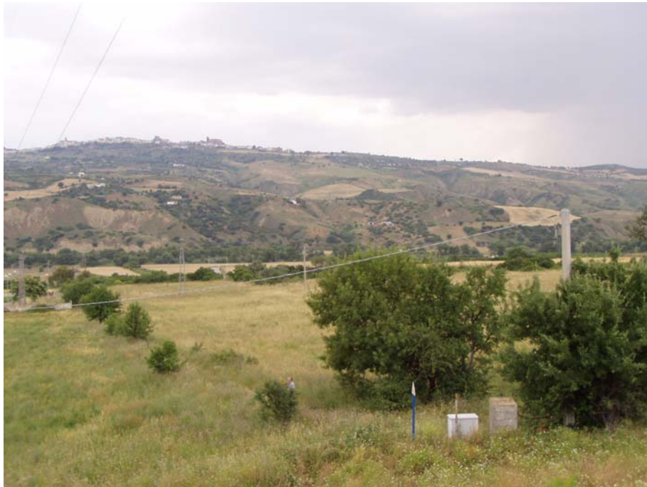
Foto 2 – Panoramica area Centrale compressione e trattamento da monte