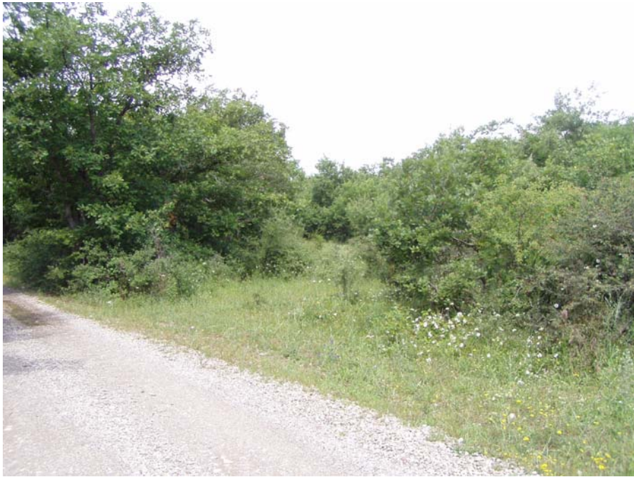
Foto 14 – Tracciato del metanodotto tra innesto GR 33 – 35 e la Cameretta 2