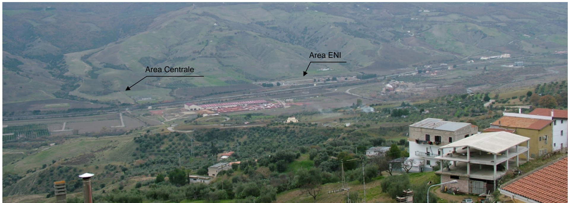
Foto 20 – Panoramica dell'area Centrale e dell'area ENI (ex Centrale gas)