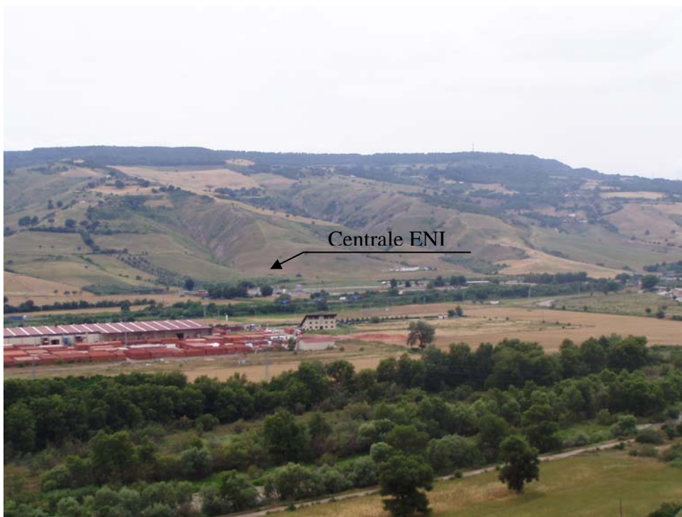
Foto 17-18 – Panoramica della Centrale di Trattamento e compressione ENI esistente