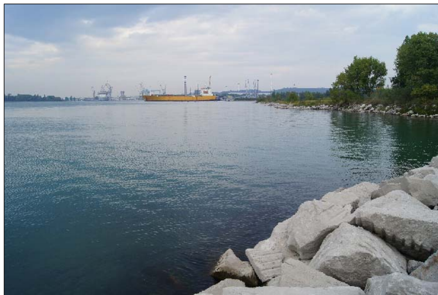
1 - Vista dell'area di accosto verso Nord-Ovest