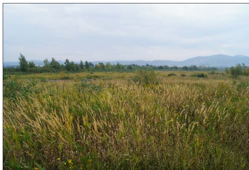
6 - Veduta verso Nord-Est della parte centrale della colmata