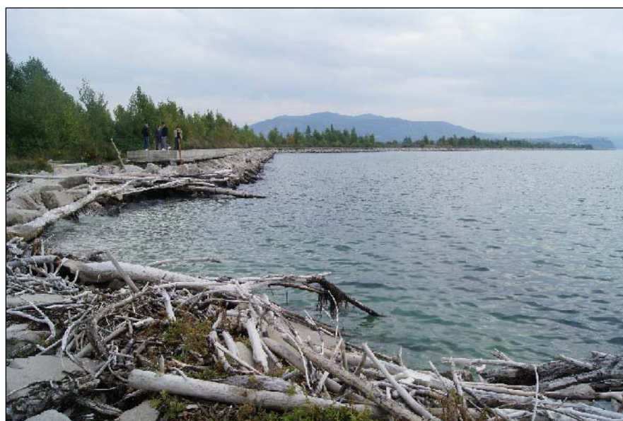
3 - Scogliera di massi a protezione della colmata