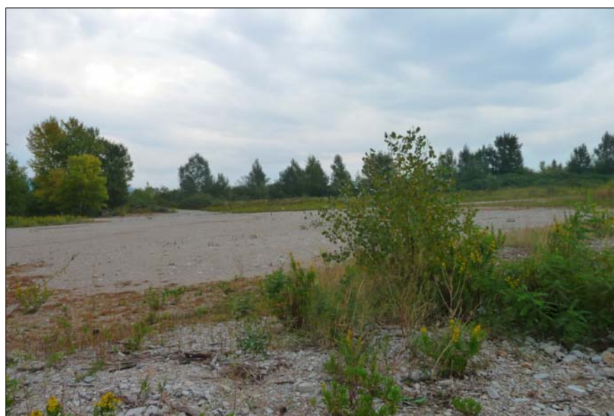
5 - Aree retrostanti il limite Sud-Ovest della colmata