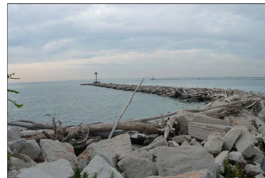
7 - Digue di accesso al porto