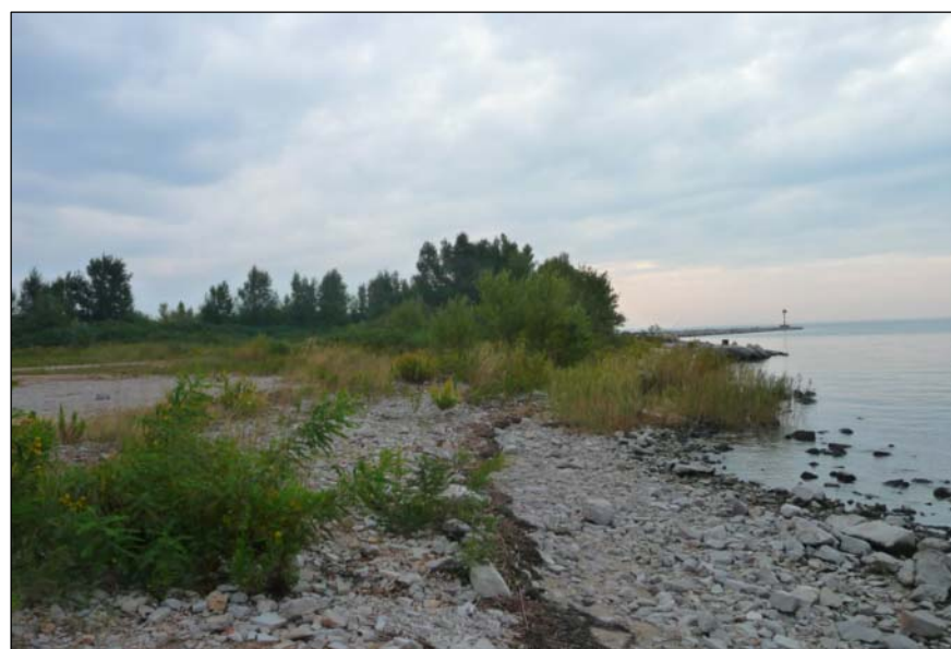
4 - Limite Sud-Ovest della colmata