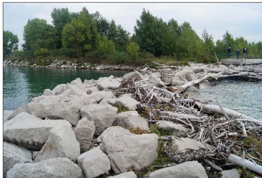
2 - Vegetazione arborea ai margini della colmata