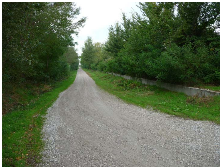
3 - Viabilità d'accesso vista verso Ovest