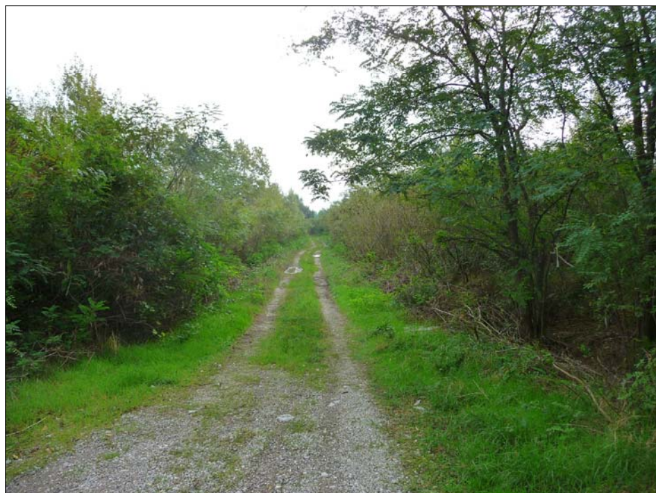
2 - Viabilità d'accesso vista verso Est