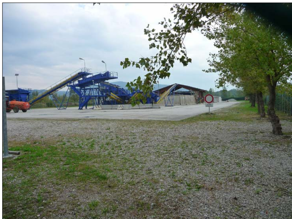
1 - Area impianto di trattamento che sarà occupata dal terminale