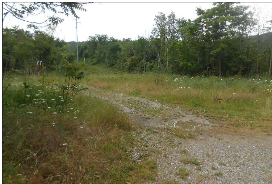
5 - Vista su area stazione di intercettazione