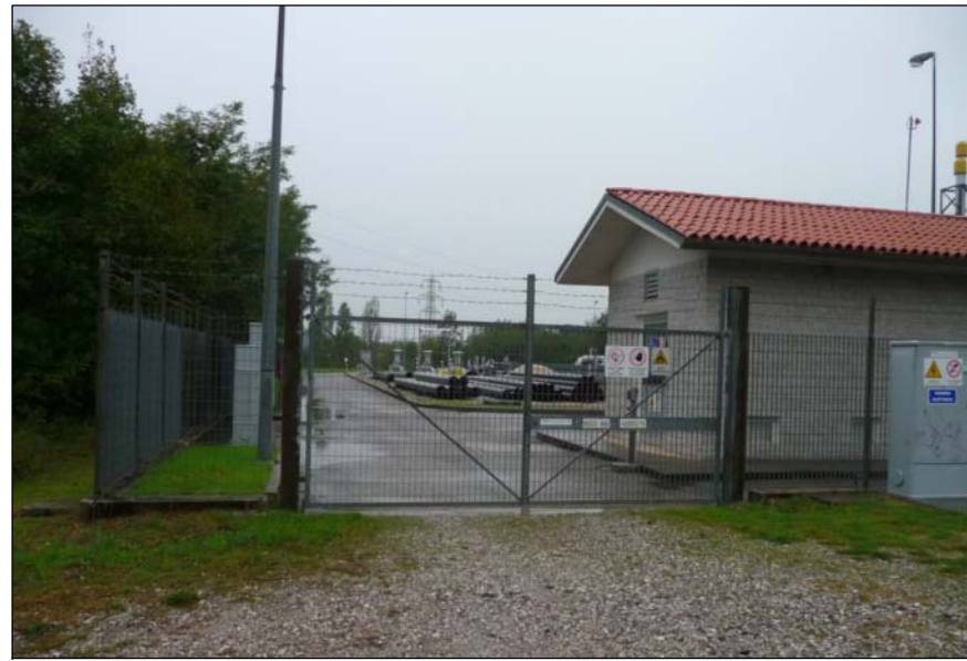
2 - Stazione SNAM Rete Gas (Nodo No. 899) ingresso