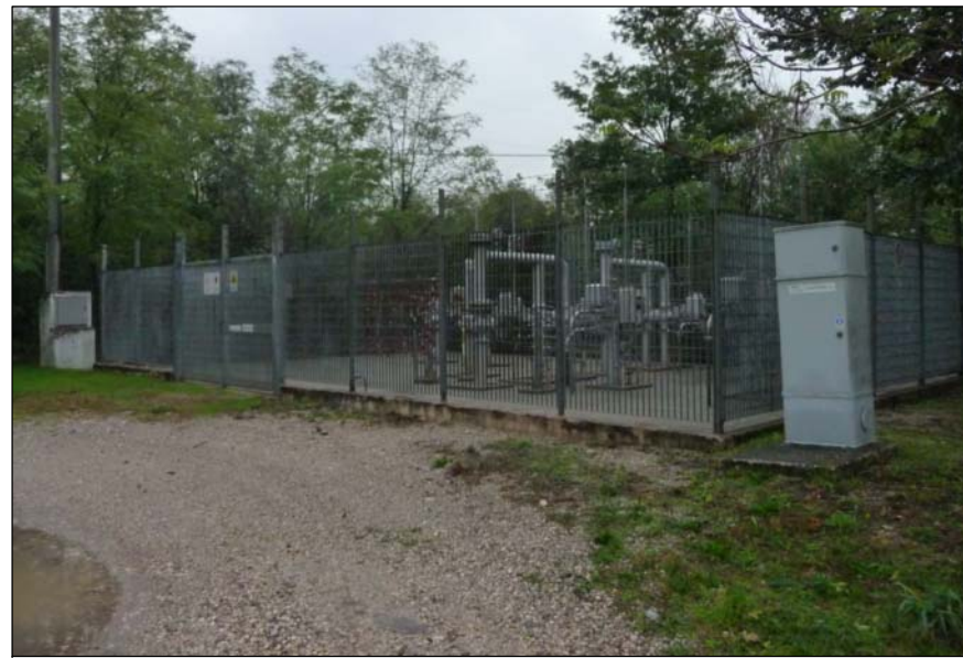
4 - Impianto SNAM Rete Gas