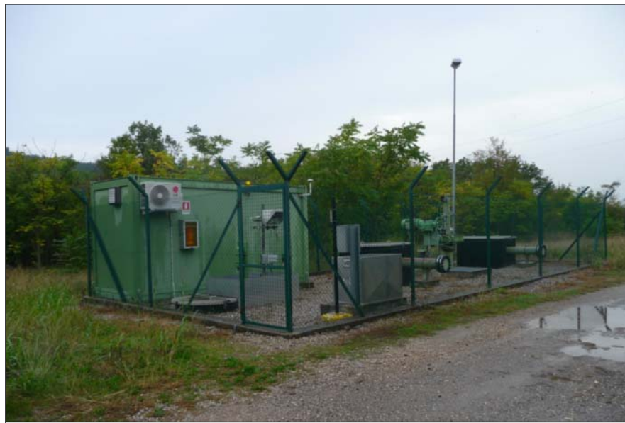
3 - Impianto di sezionamento per Oleodotto Transalpino (SIOT)