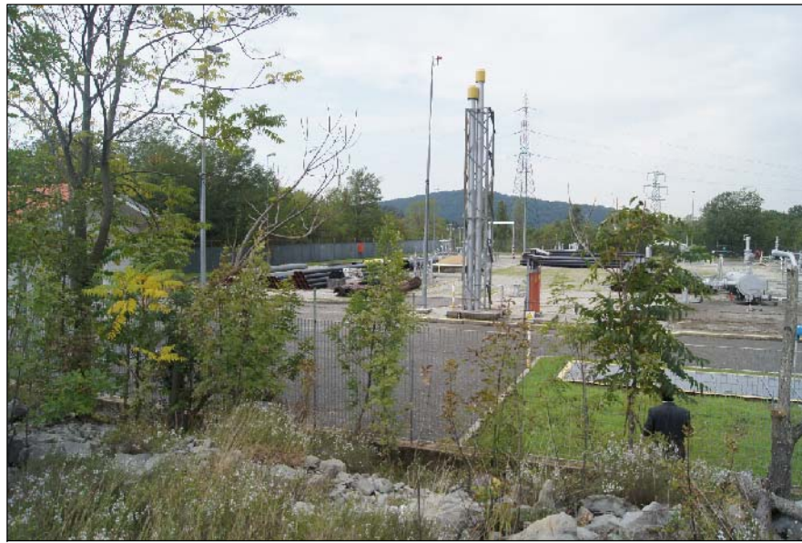
1 - Stazione SNAM Rete Gas (Nodo No. 899) vista globale