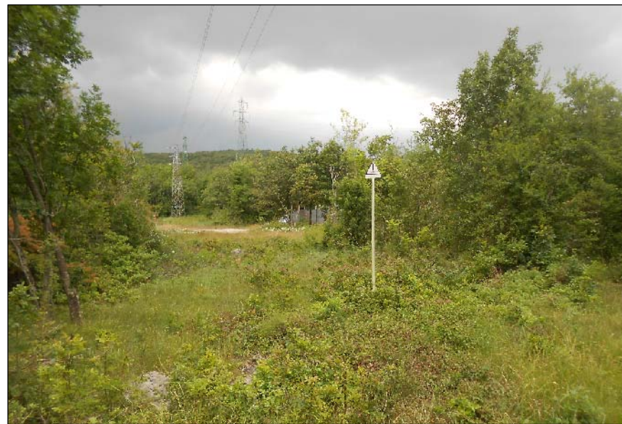
6 - Vista su area stazione di intercettazione