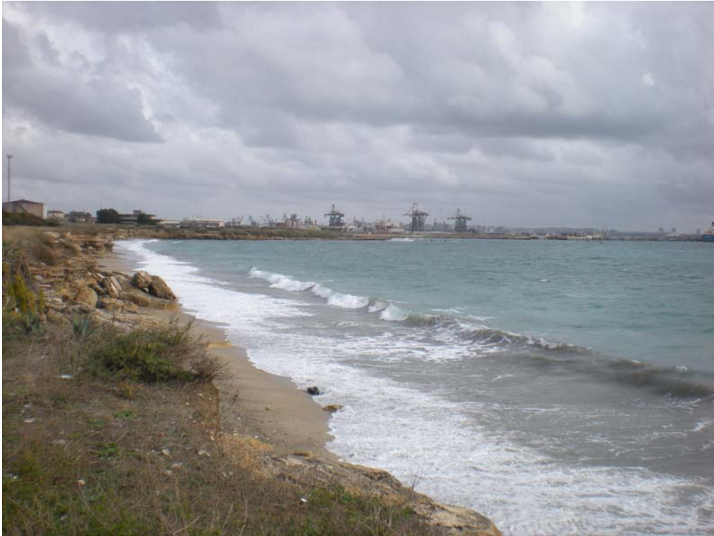
Figura 5– Vista verso l'area di progetto dal punto di vista n. 4