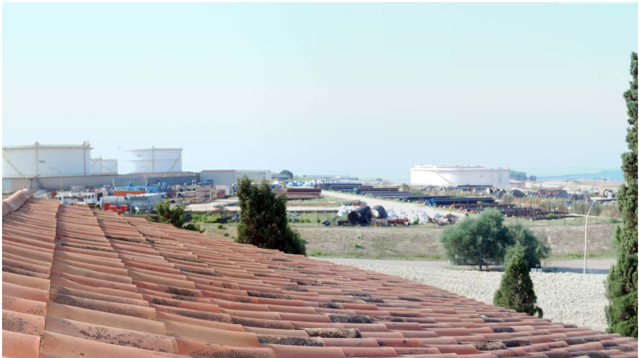
Figura 6– Vista verso l'area di progetto dal punto di vista n. 5