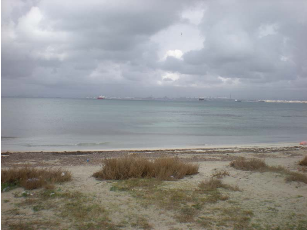
Figura 4– Vista verso l'area di progetto dal punto di vista n. 3