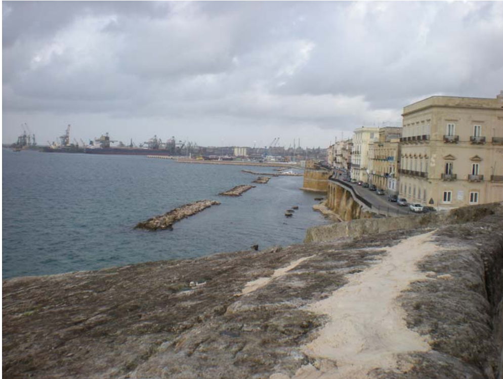
Figura 2 – Vista verso l’area di progetto dal punto di vista n. 1