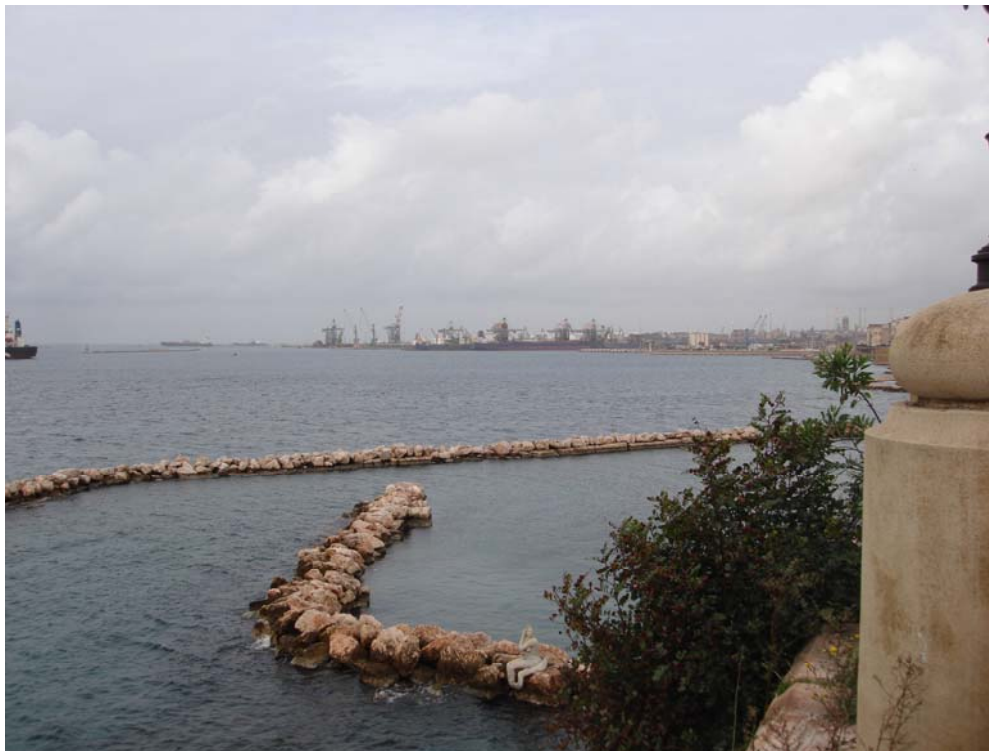
Figura 3– Vista verso l’area di progetto dal punto di vista n. 2