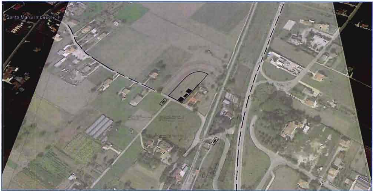
Figura 2 - Vista aerea dell'area in cui si inserisce il cantiere (ortofoto da Google Earth, agg. set 2014)