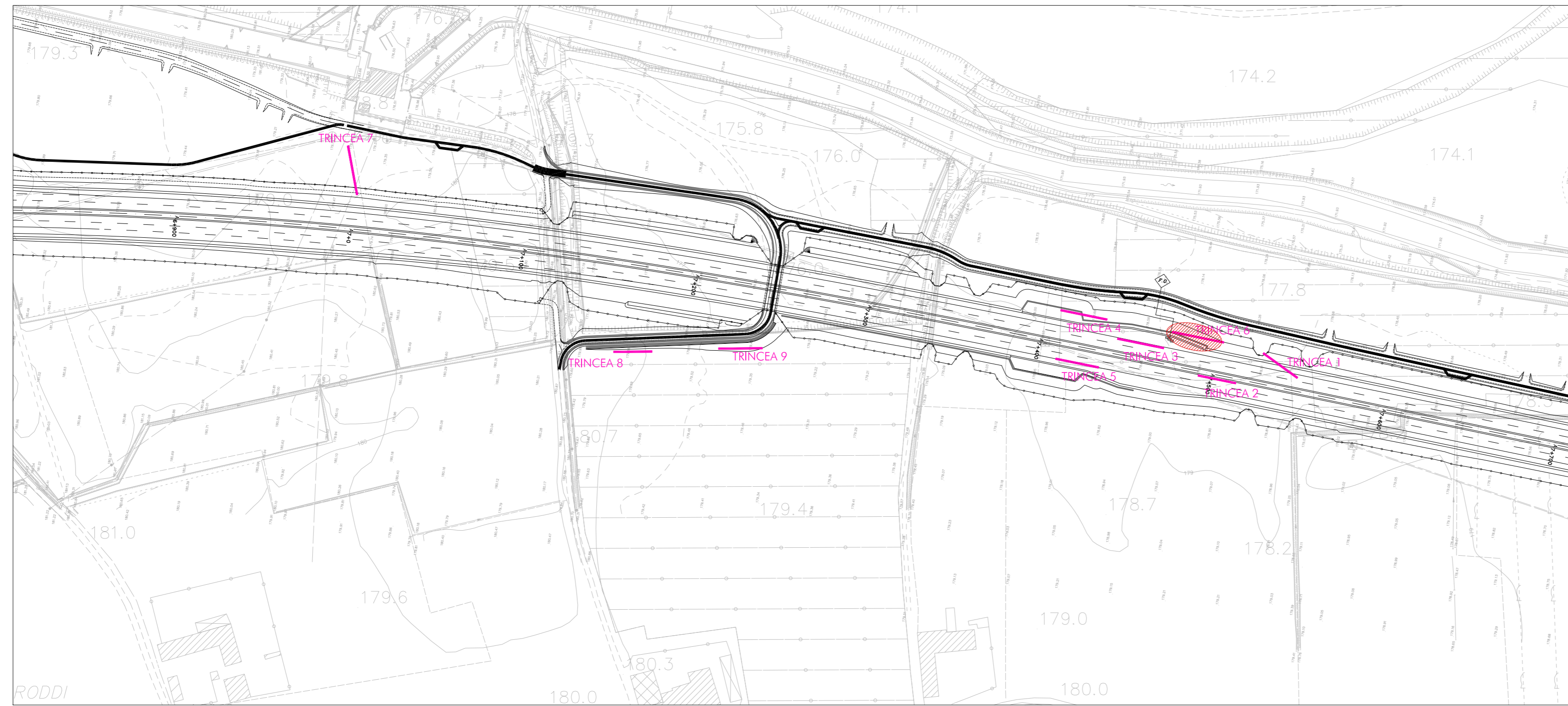
SEZIONI ESEMPLIFICATIVE DELLE TRINCEE - SCALA 1:50