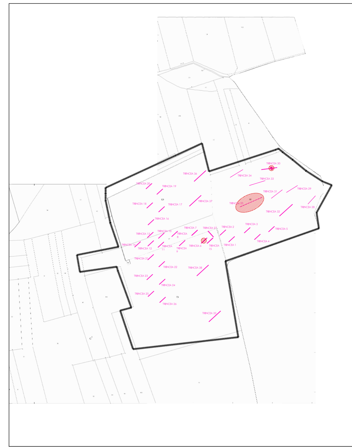
Planimetria delle indagini eseguite su base catastale - scala 1:5000