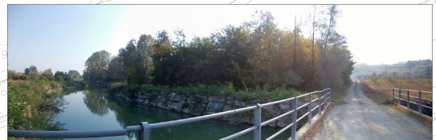
Foto 2: Superficie boscata diffusa sul fondovalle alluvionale del Fiume Tanaro - tratto non interferito