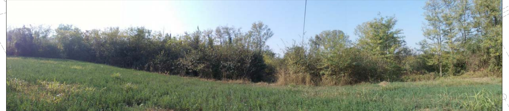
Foto 1: Superficie boscata diffusa sul fondovalle alluvionale del Fiume Tanaro - tratto non interferito