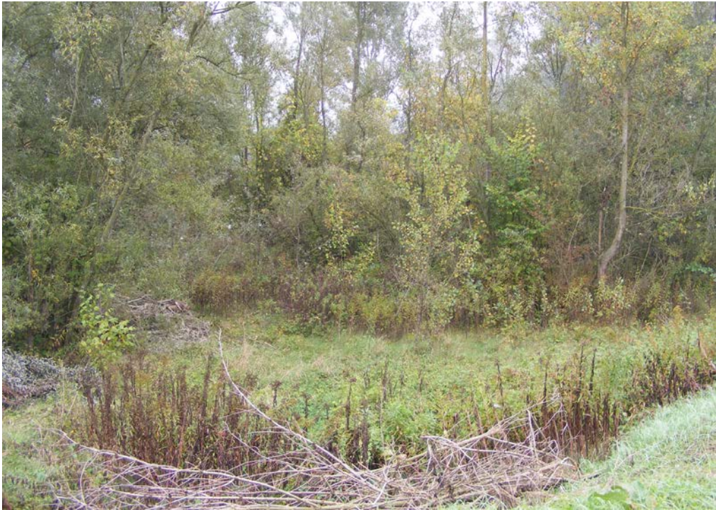
Figura 1 (15-10-2012)