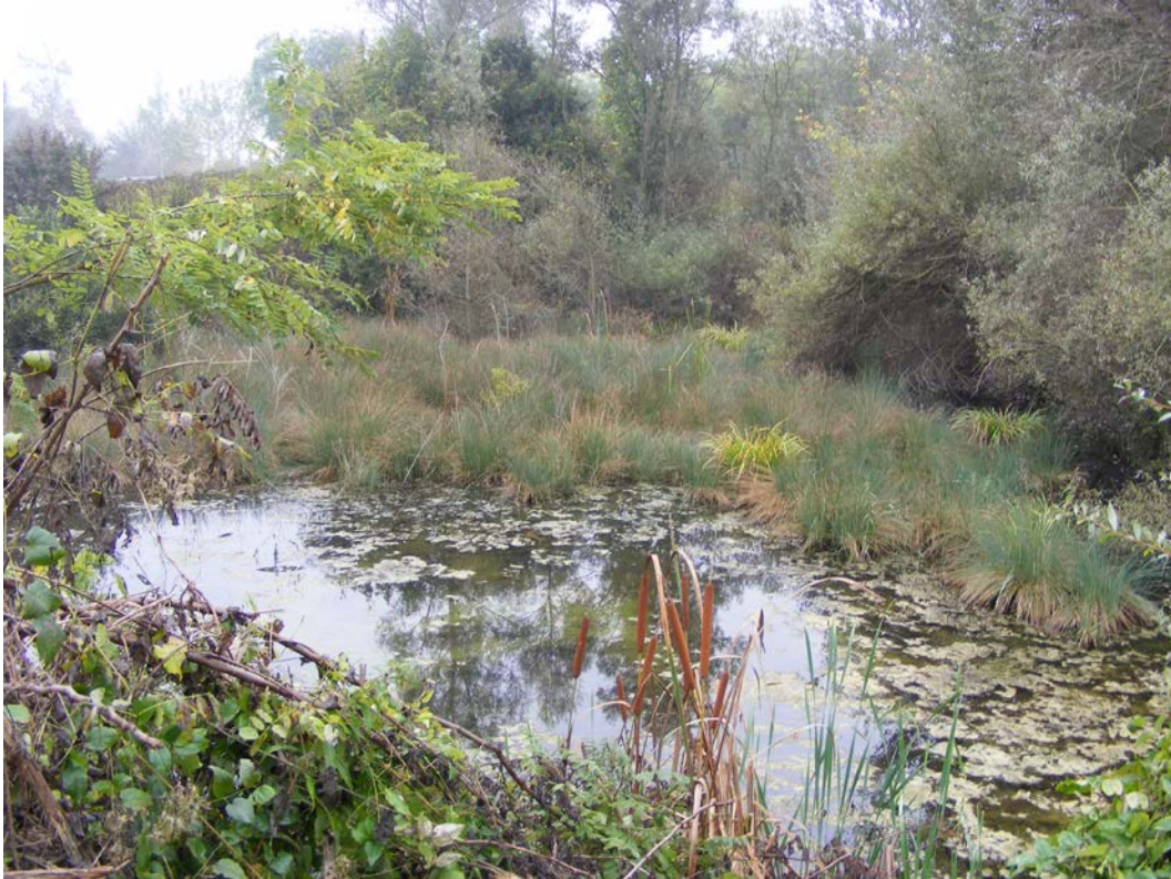
Figura 8 (15-10-2012)