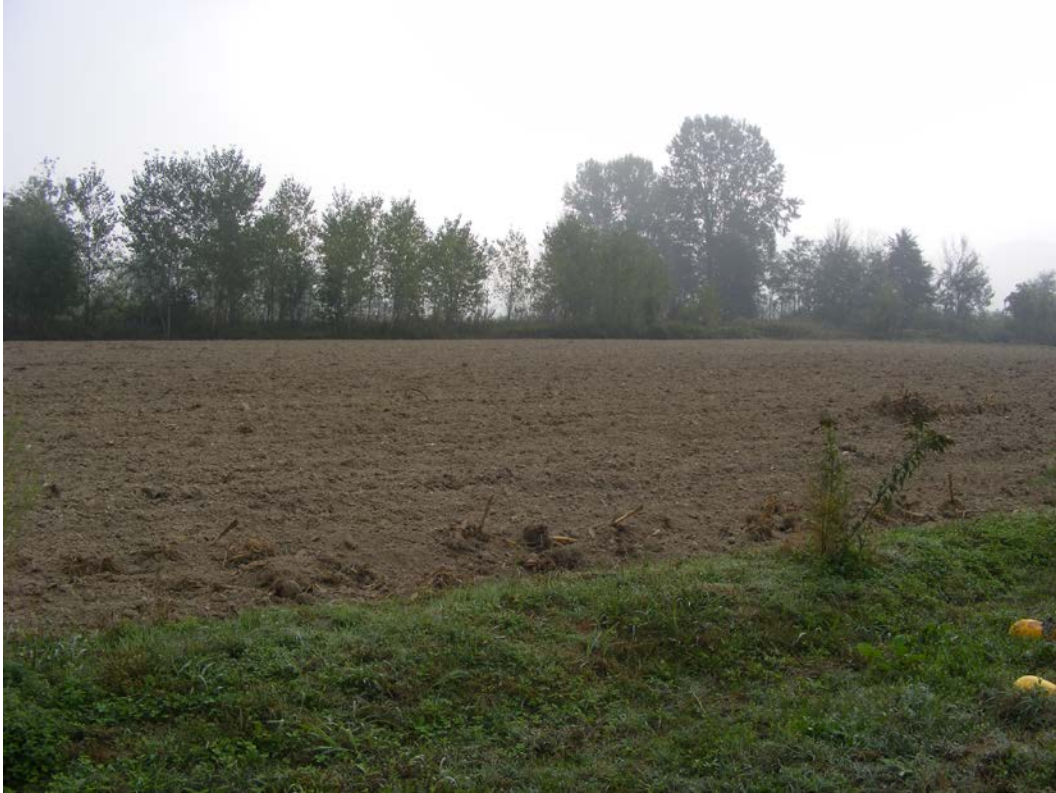
Figura 16 (15-10-2012)