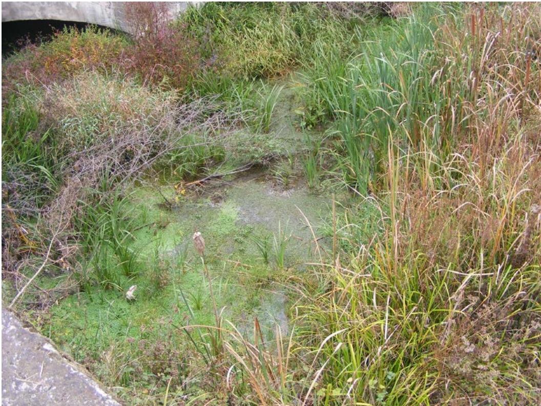
Figura 9 (15-10-2012)