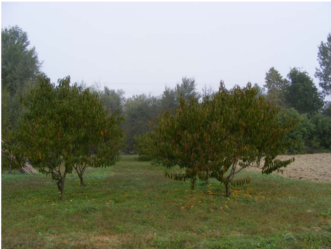
Figura 13 (15-10-2012)