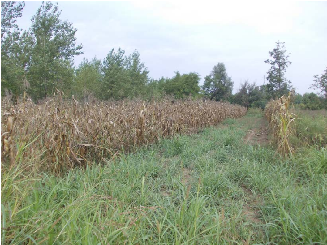
Figura 18 (06-09-2012)