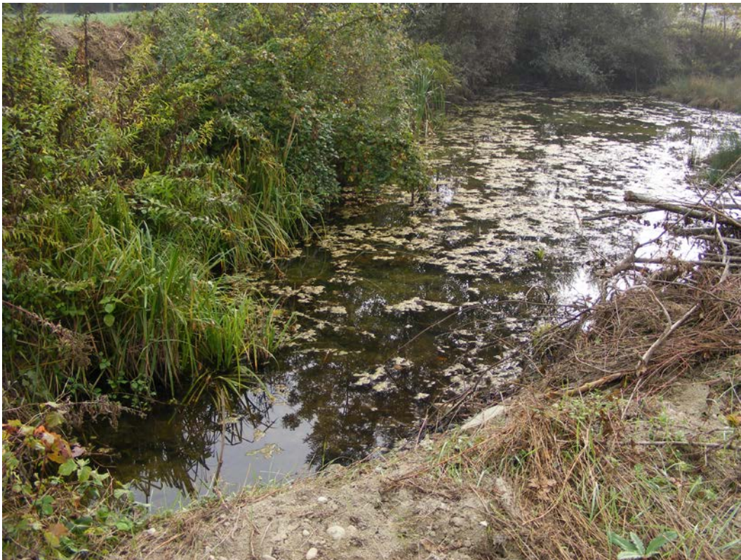
Figura 7 (15-10-2012)