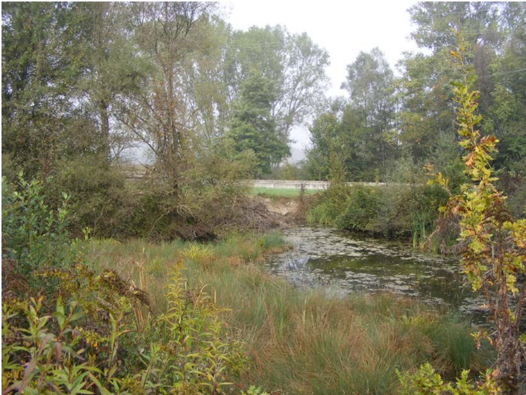
Figura 11 (15-10-2012)