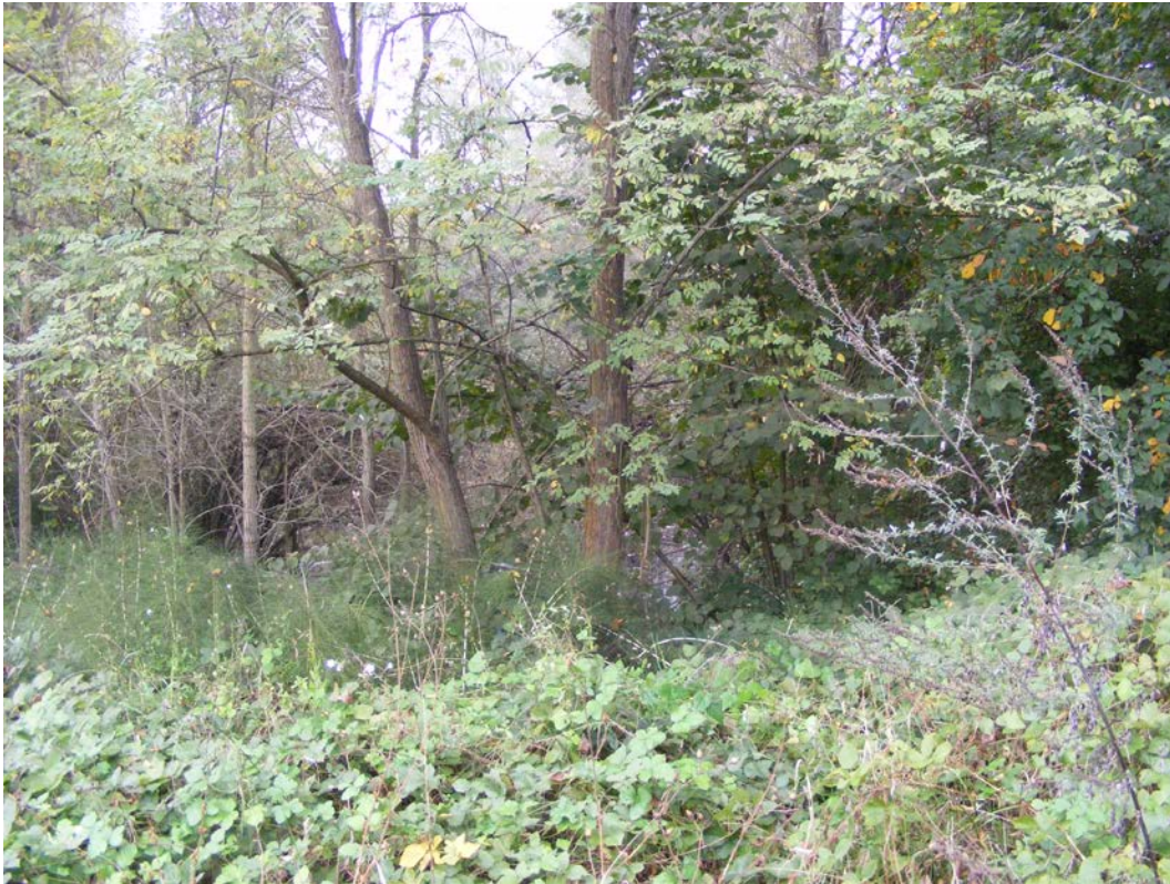
Figura 6 (15-10-2012)