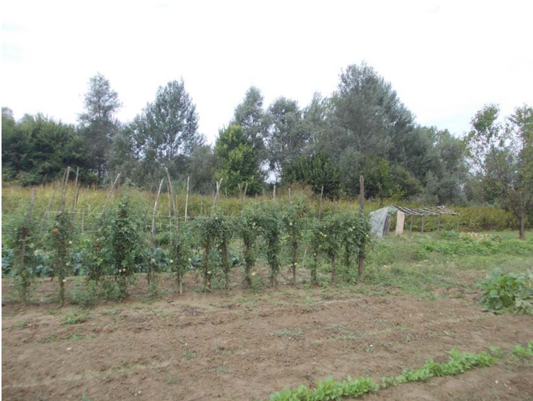
Figura 15 (06-09-2012)