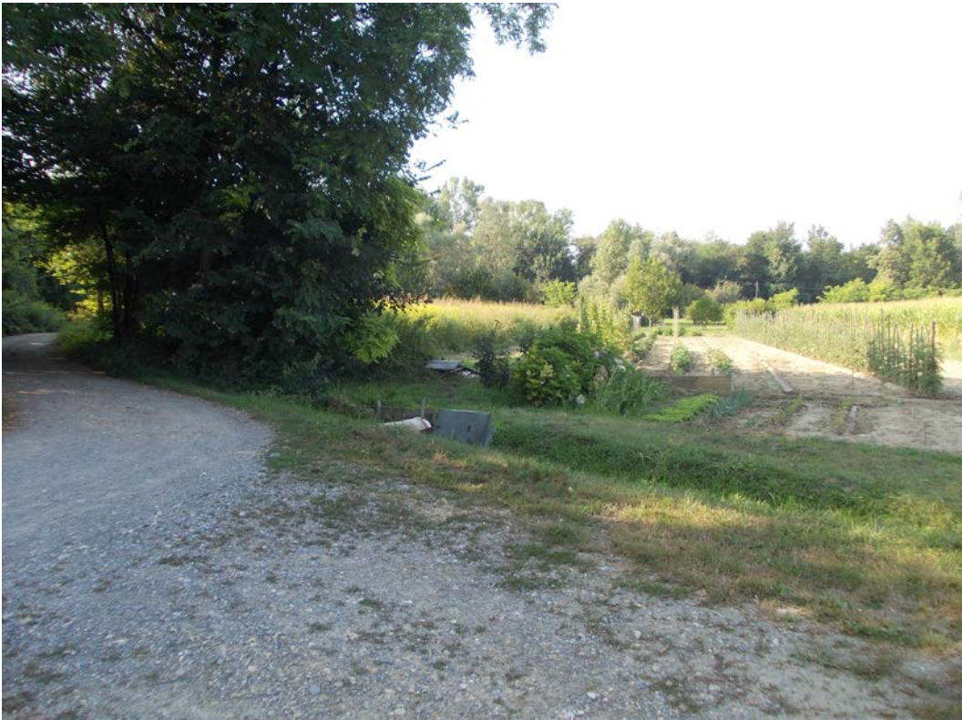
Figura 17 (24-07-2012)