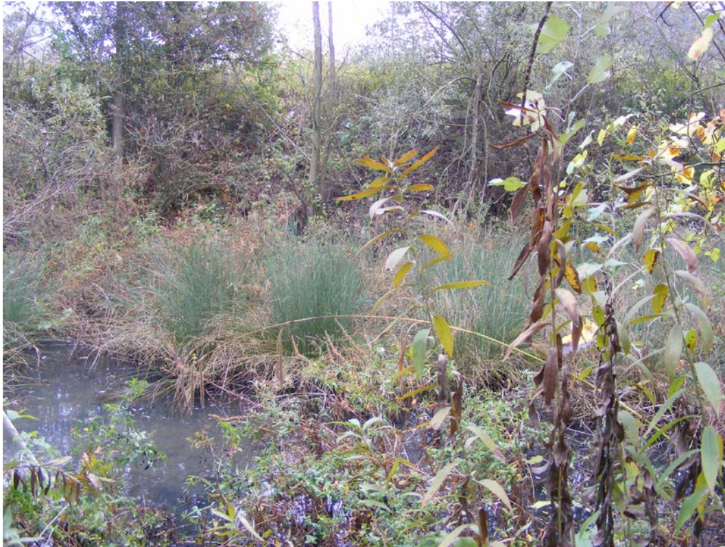
Figura 4 (15-10-2012)