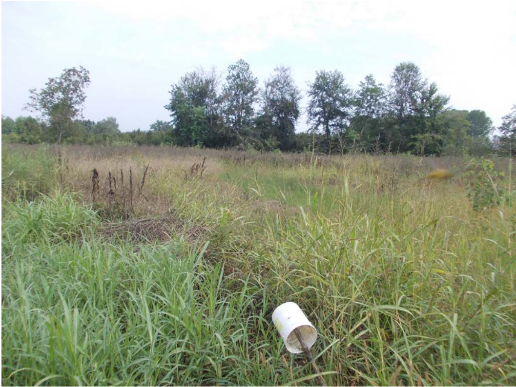
Figura 20 (06-09-2012)