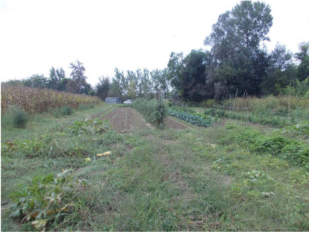
Figura 14 (06-09-2012)