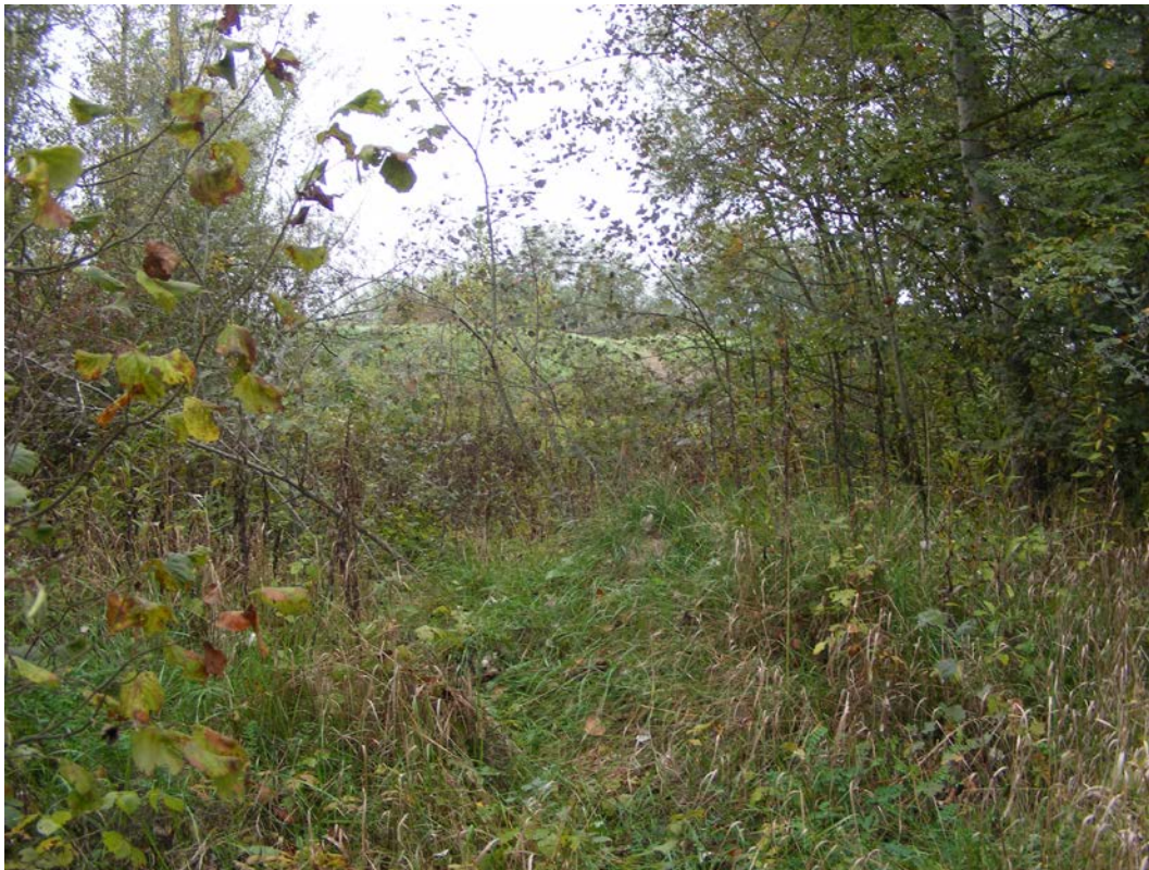
Figura 5 (15-10-2012)