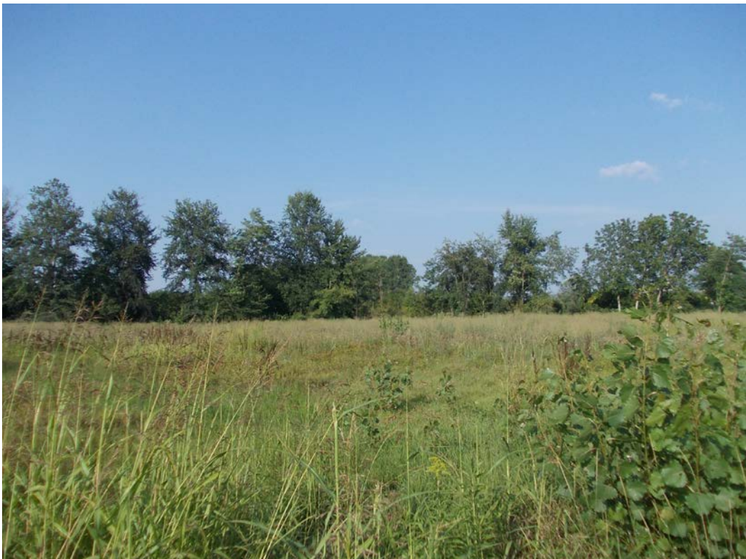
Figura 19 (24-07-2012)