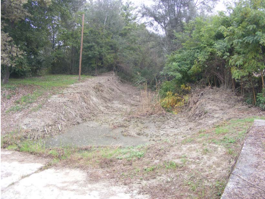
Figura 10 (15-10-2012)