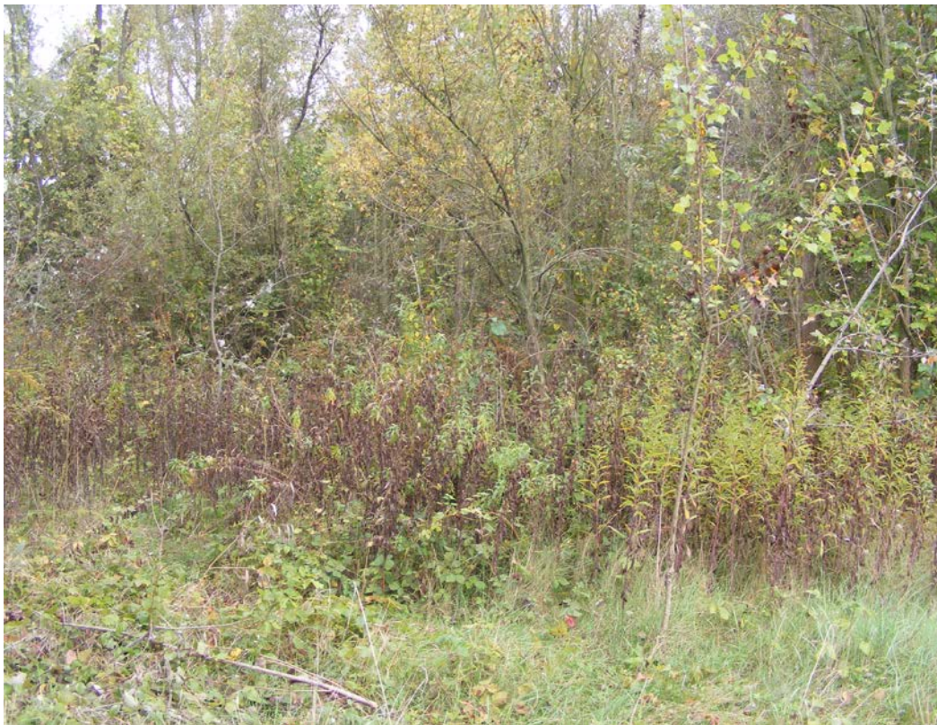
Figura 2 (15-10-2012)