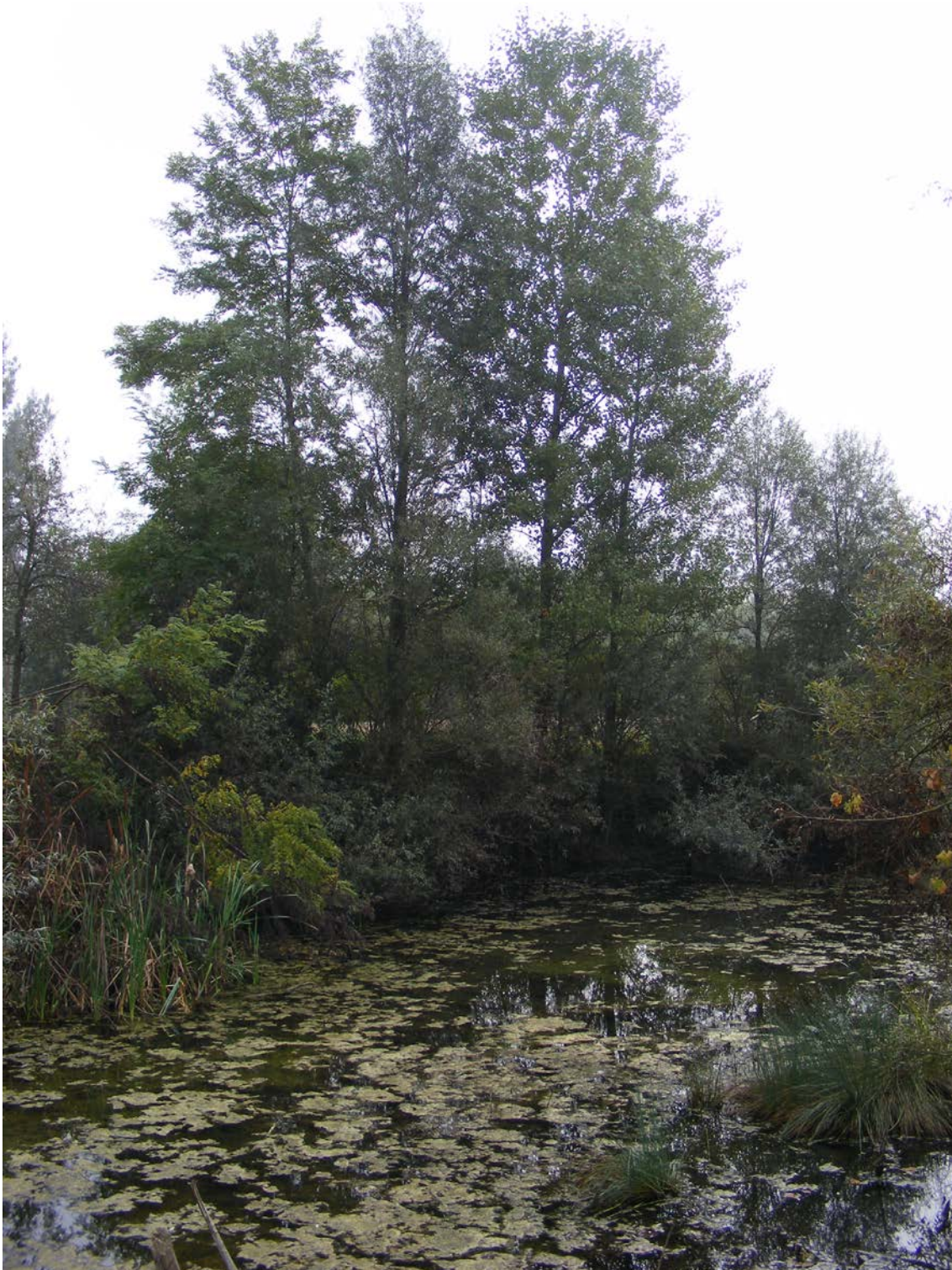
Figura 3 (15-10-2012)