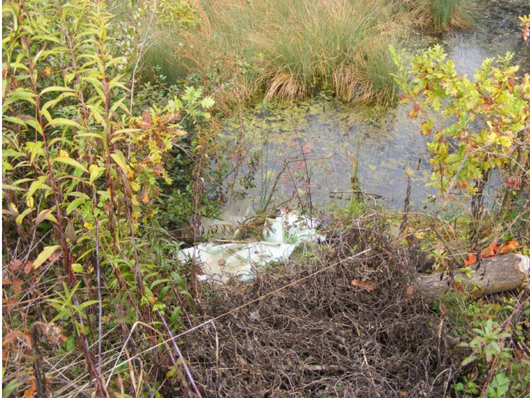
Figura 12 (15-10-2012)