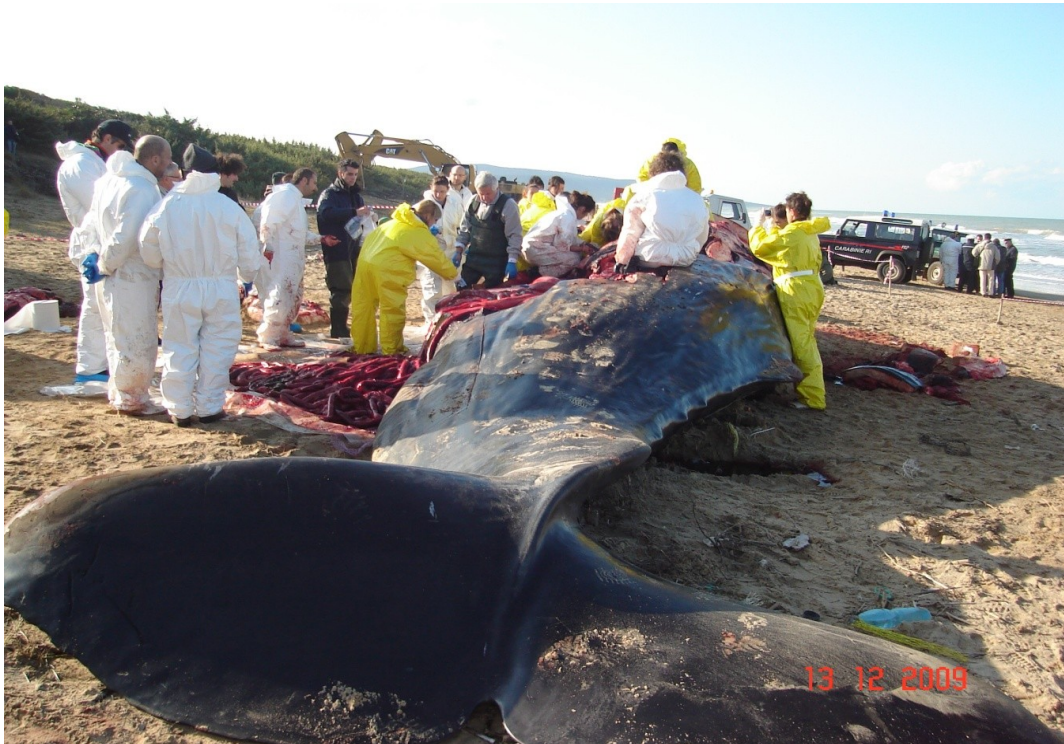
One of the 7 Sperm Whales stranded December 2009 on the Apulian coast.

Monopoli authorized by British Northern Petroleum Company, and military exercises with sonar. These are just two of the numerous accidents of Cetaceans stranding, even of individual animal, documented in the Adriatic, Sicilian and Mediterranean Sea shore, potentially associated with this type of activity.