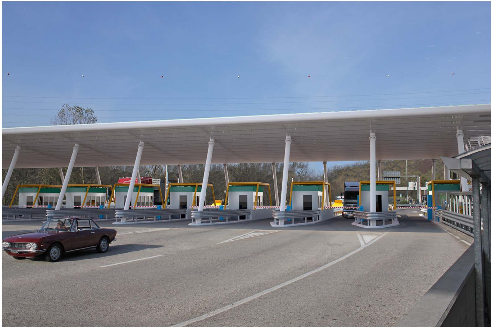
Vista da sud-est – barriera di uscita per i veicoli provenienti da Venezia – stato di progetto