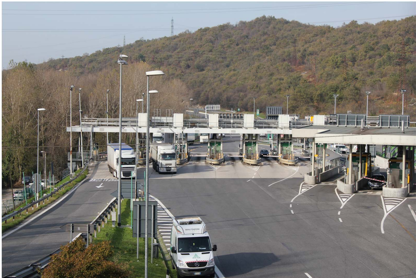
Vista da sud-est – piazzale di uscita per i veicoli provenienti da Venezia – stato di fatto