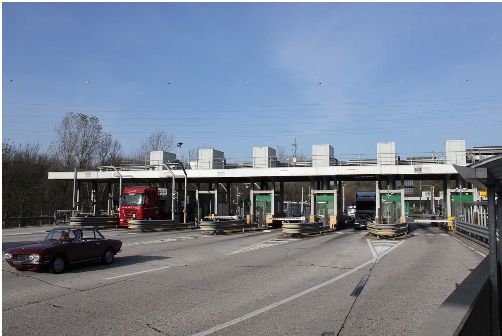
Vista da sud-est – barriera di uscita per i veicoli provenienti da Venezia – stato di fatto