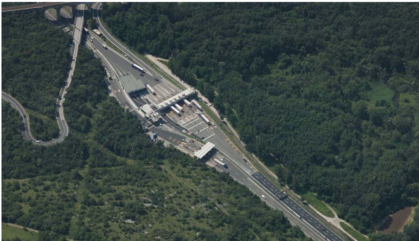
Vista aerea da nord – stato di fatto