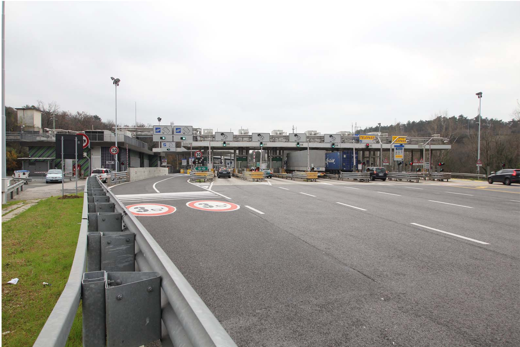
Vista da nord ovest – barriera di uscita per i veicoli provenienti da Venezia – stato di fatto