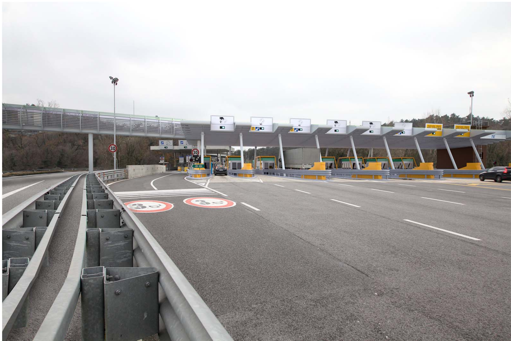
Vista da nord ovest – barriera di uscita per i veicoli provenienti da Venezia – stato di progetto