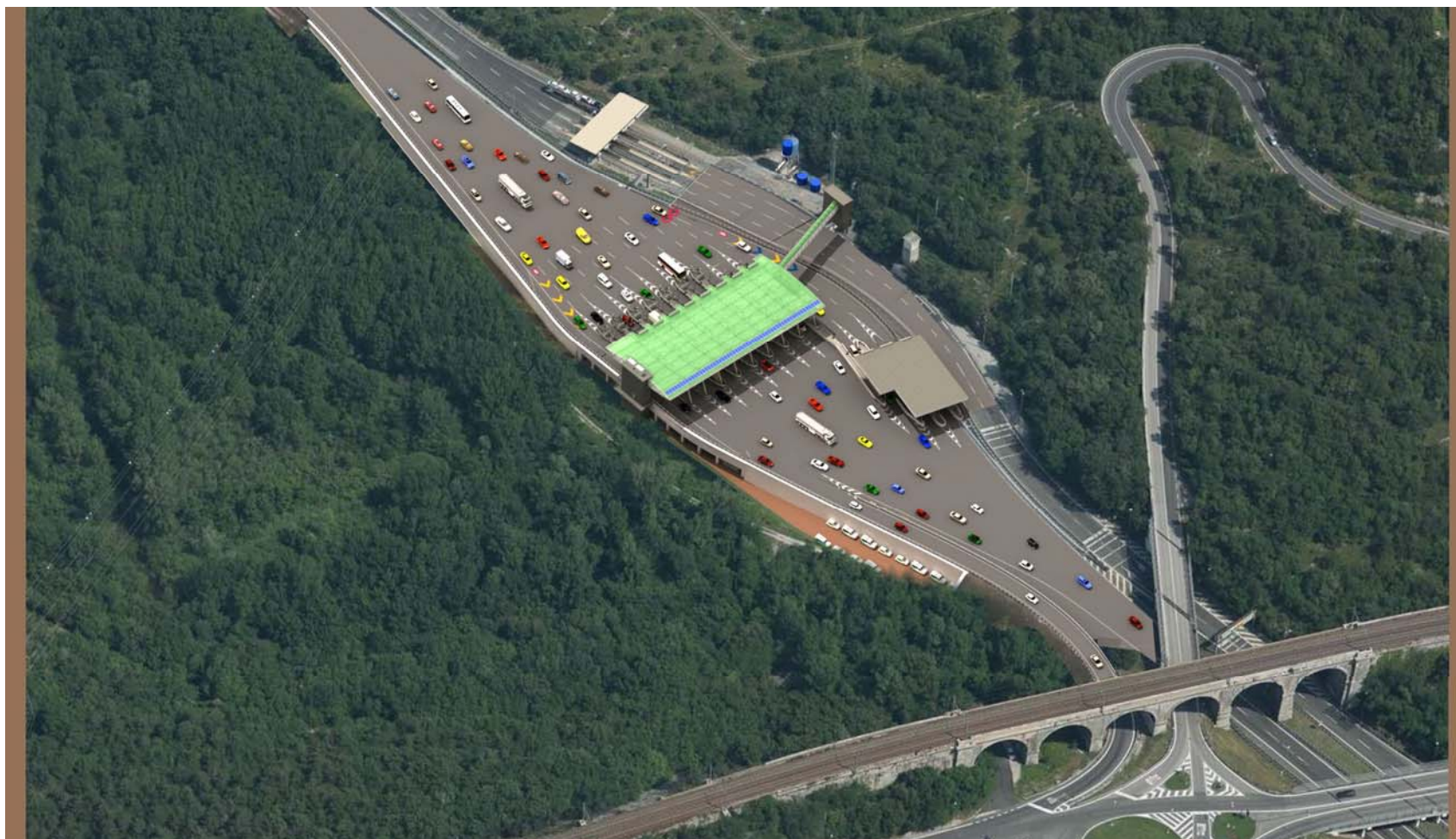
Vista aerea da sud – stato di progetto