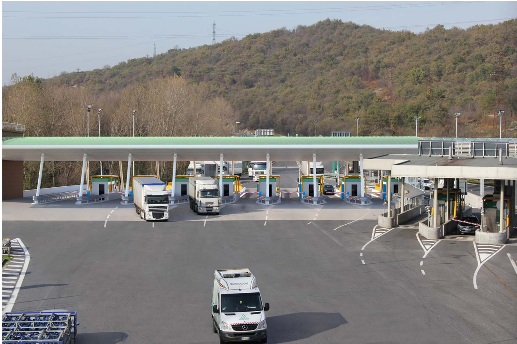
Vista da sud-est – piazzale di uscita per i veicoli provenienti da Venezia – stato di progetto