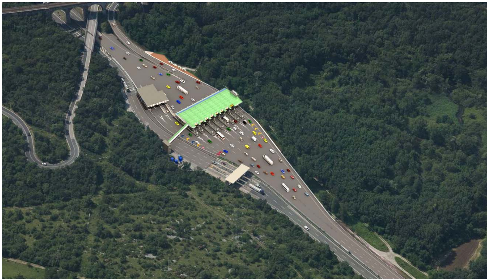
Vista aerea da nord – stato di progetto