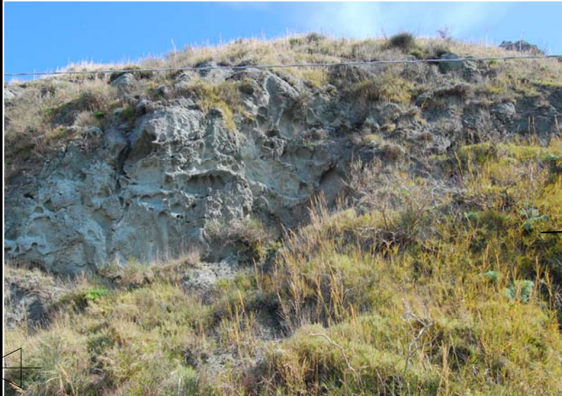
Vista scarpata esistente

Messa in sicurezza previa rimozione del materiale instabile e rivestimento con rete metallica ancorata con picchetti metallici