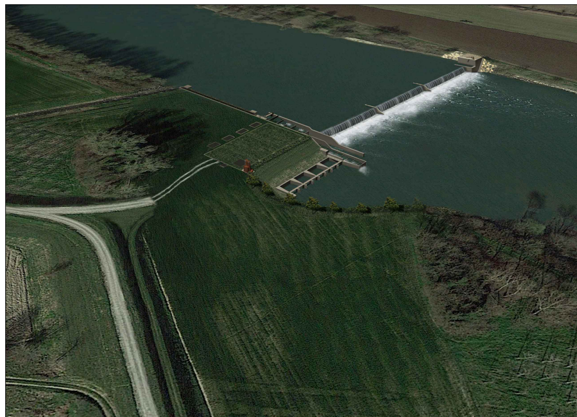
VISTA DALL'ARGINE DESTRO (F2) SIMULAZIONE FOTOGRAFICA