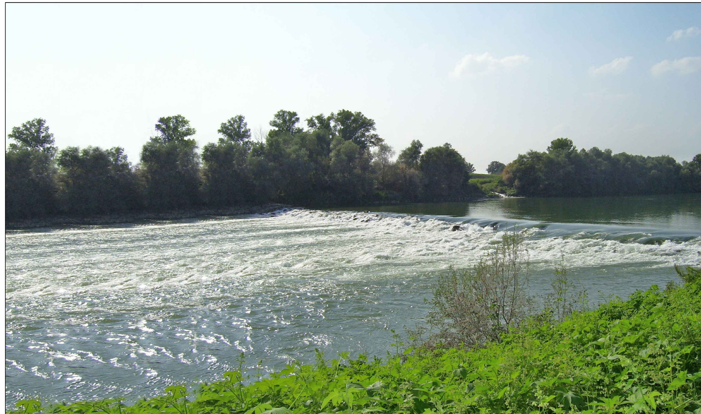
VISTA DALL'ARGINE SINISTRO (F3) STATO DI FATTO