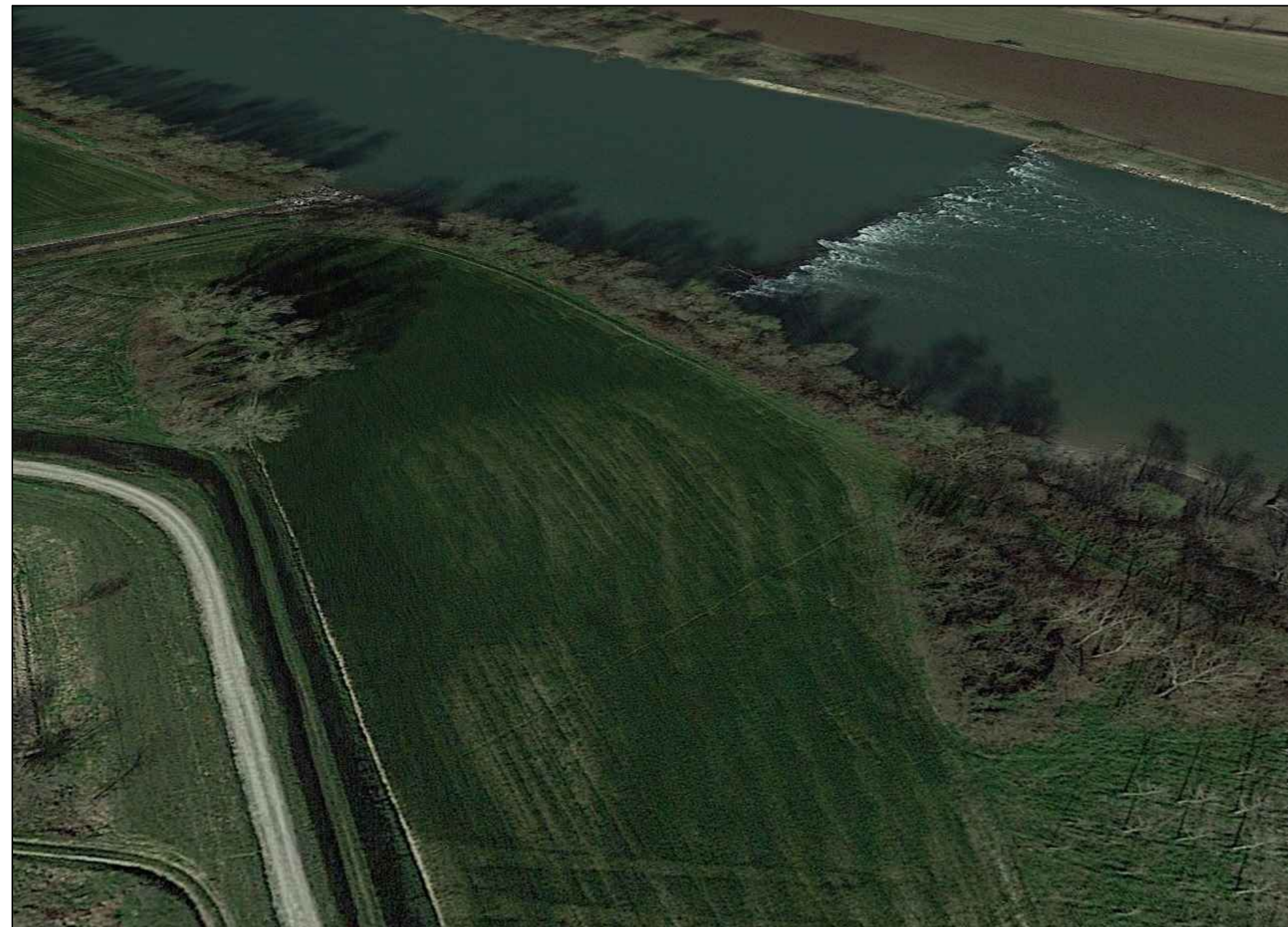
VISTA DALL'ARGINE DESTRO (F2) STATO DI FATTO