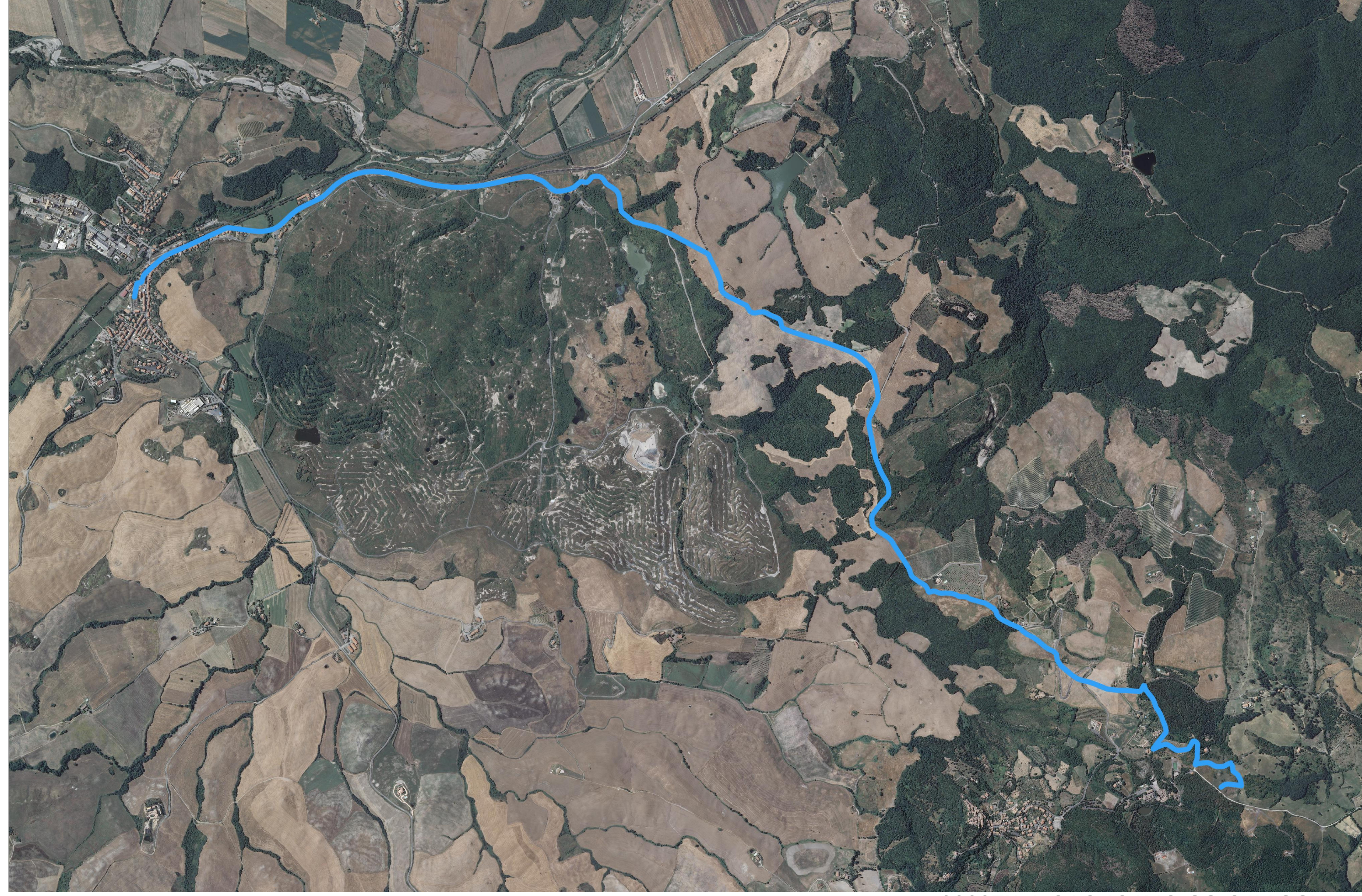
TRACCIATO SU ORTOFOTO 1:20000

PERMESSO DI RICERCA DI RISORSE GEOTERMICHE FINALIZZATO ALLA SPERIMENTAZIONE DI UN IMPIANTO PILOTA CONVENZIONALMENTE DENOMINATO "CORTOLLA" COMUNE DI MONTECATINI VAL DI CECINA - PROVINCIA DI PISA