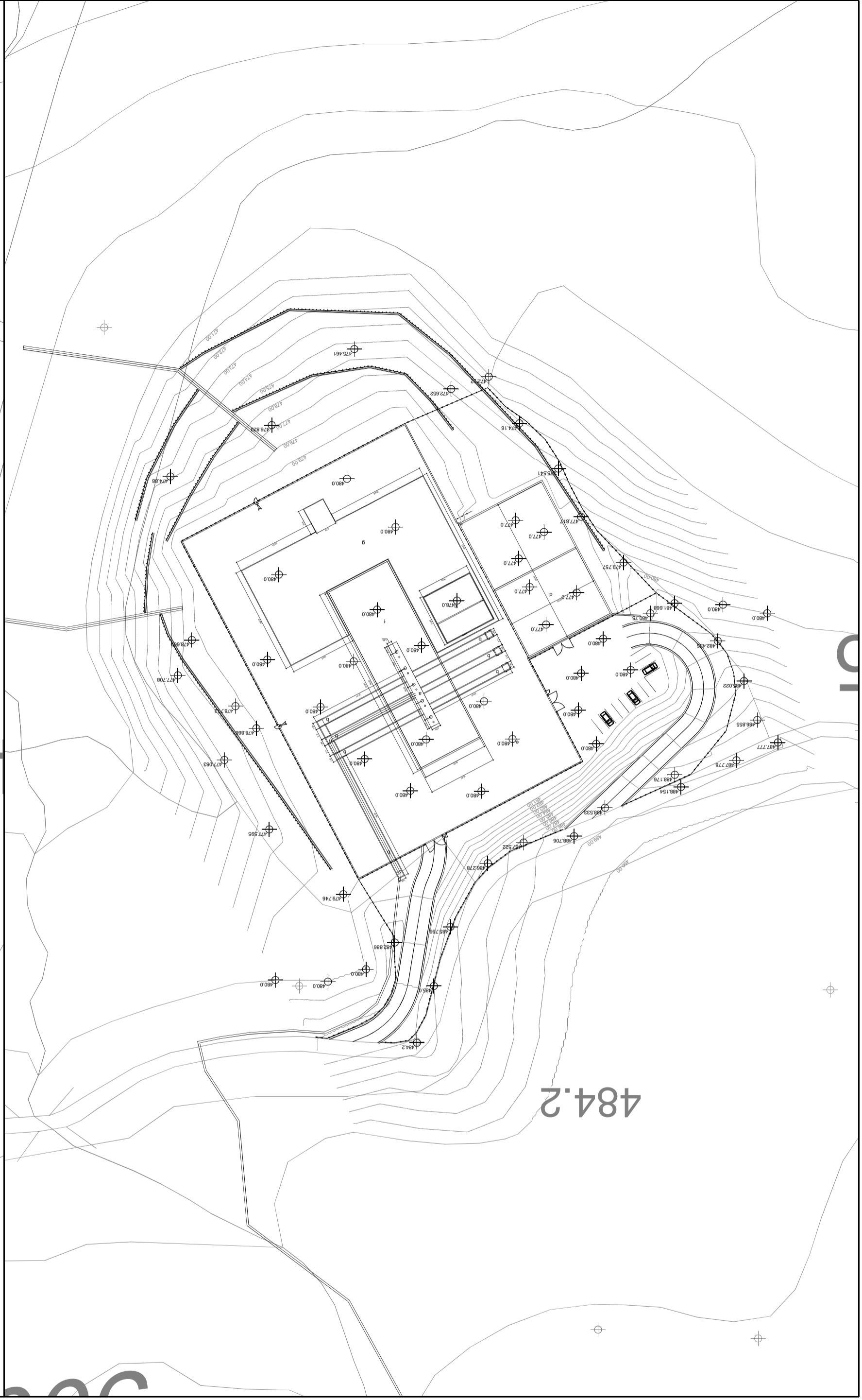
AREA POZZO CORTOLLA 1 1:1000