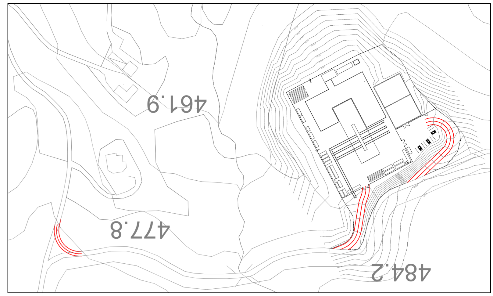
VIABILITA DI DETTAGLIO POLO DI PRODUZIONE - 1:2000