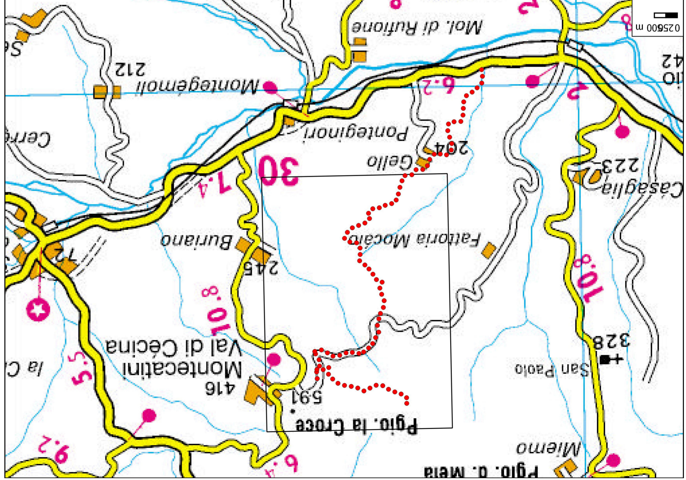
LEGENDA Strada da realizzare/adequare