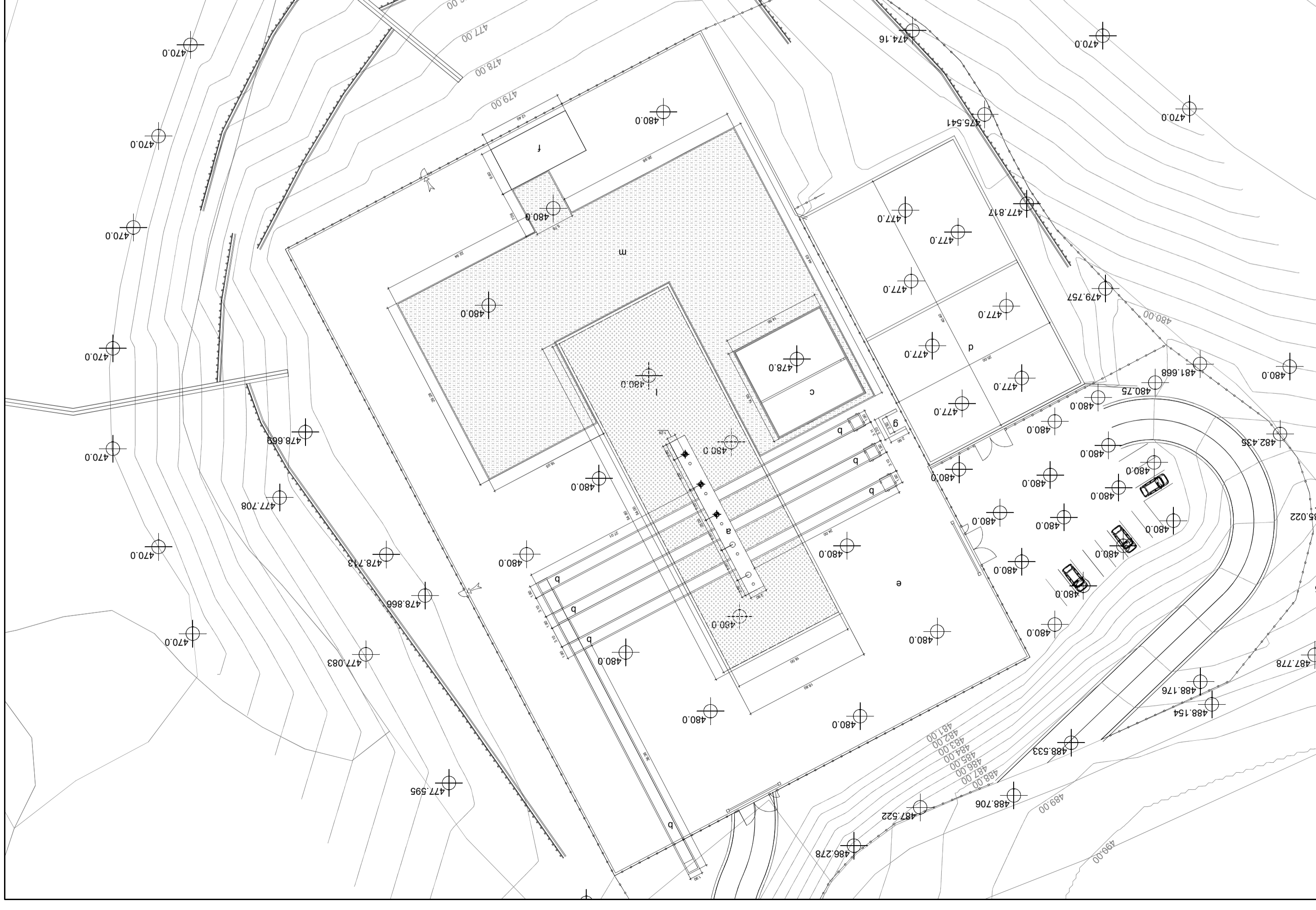
OPERE CIVILI PIAZZOLA CORTOLLA 1 - 1:500