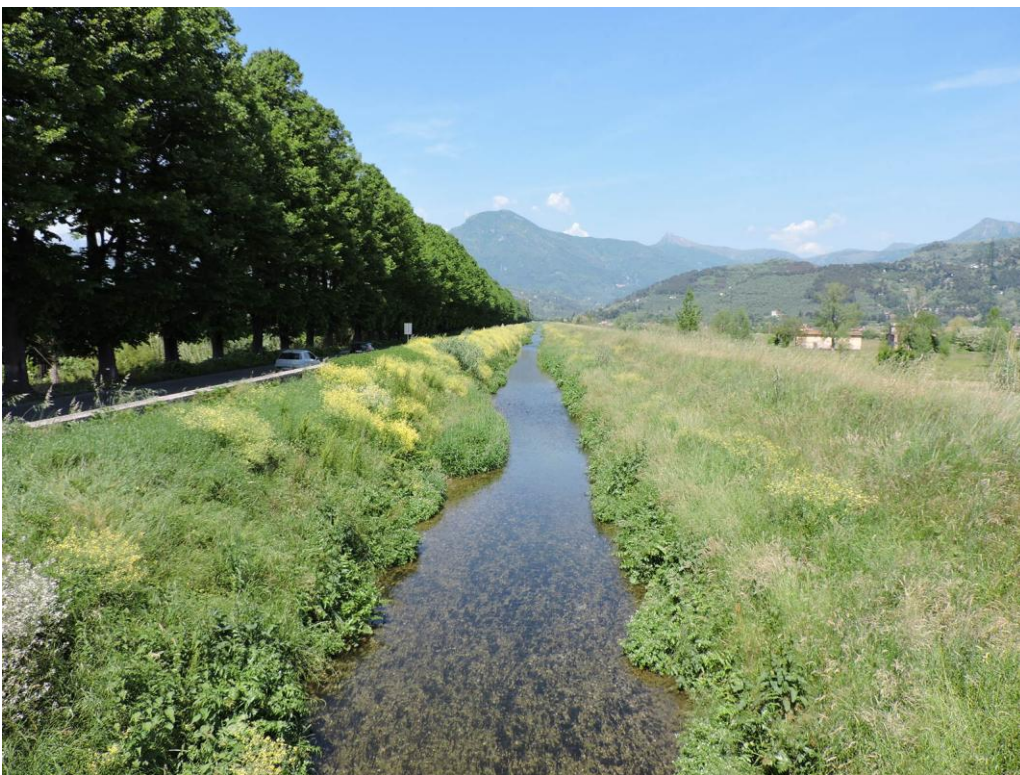
Fig. 1 - Stato attuale dell'alveo del fiume di Camaione nel tratto pensile non ancora arginato con cemento armato.

della fascia di vegetazione riparia, dell'assetto della piana, o subisca altri interventi di artificializzazione, mantenendo formalmente invariata la classificazione. E' auspicabile pertanto che siano previste misure supplementari siano integrate da azioni di monitoraggio mirate all'individuazione dei tratti fluviali che ricadono effettivamente nel livello di qualità ELEVATO in modo che siano tutelati da congrue misure di salvaguardia.