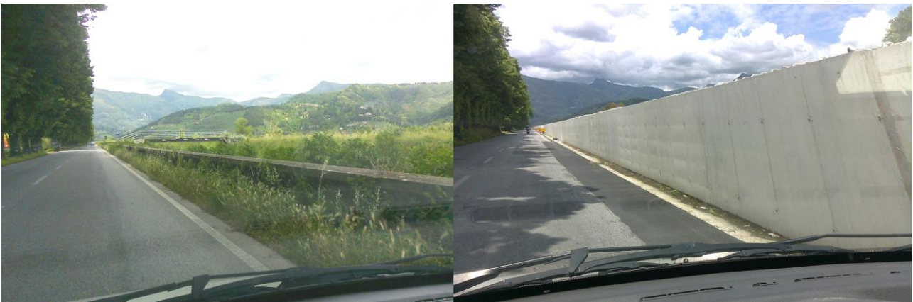
Fig. 3 – Visione della prospettiva in direzione monti percorrendo la strada provinciale posta in riva destra del fiume di Camaiore nel tratto pensile: a sinistra prima della messa in sicurezza, a destra dopo la realizzazione del nuovo argine (situazione reale non simulata, manca solo il rivestimento in pietrame!).