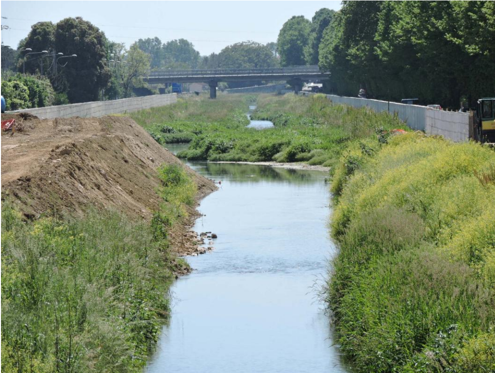
Fig. 2 – Visione prospettica verso valle del tratto modificato (sullo sfondo) e dello stato attuale dell'alveo (in primo piano) del fiume di Camaiore nel tratto pensile.