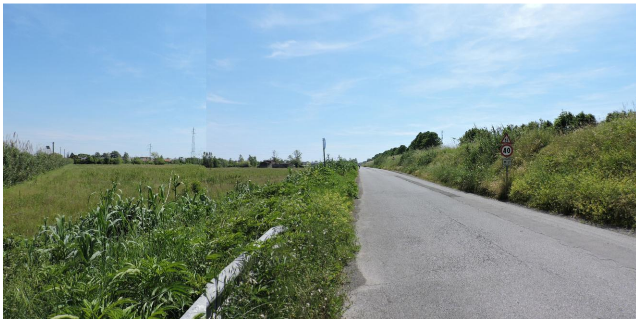
Fig. 4 – Area circostante la sponda sinistra del fiume di Camaiole allo stato attuale. Anche questo tratto, secondo il progetto, dovrà essere adeguato alla piena duecentennale. Si noti che gli ampi spazi ancora liberi da urbanizzazione consentirebbero un generoso ampliamento dell'alveo (allontanando la strada dal fiume).