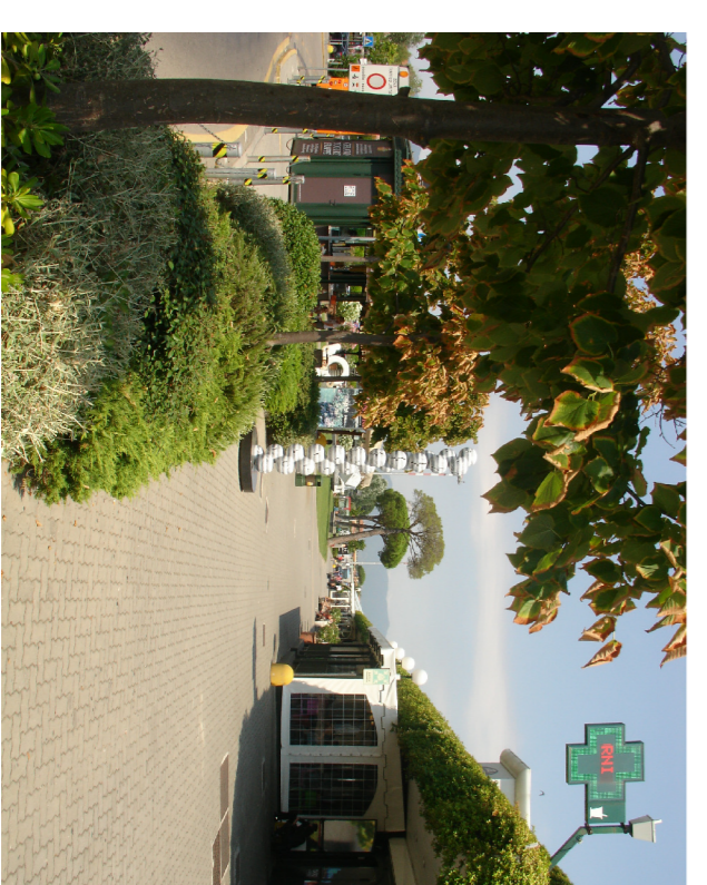
verde fronte Terminal Passeggeri