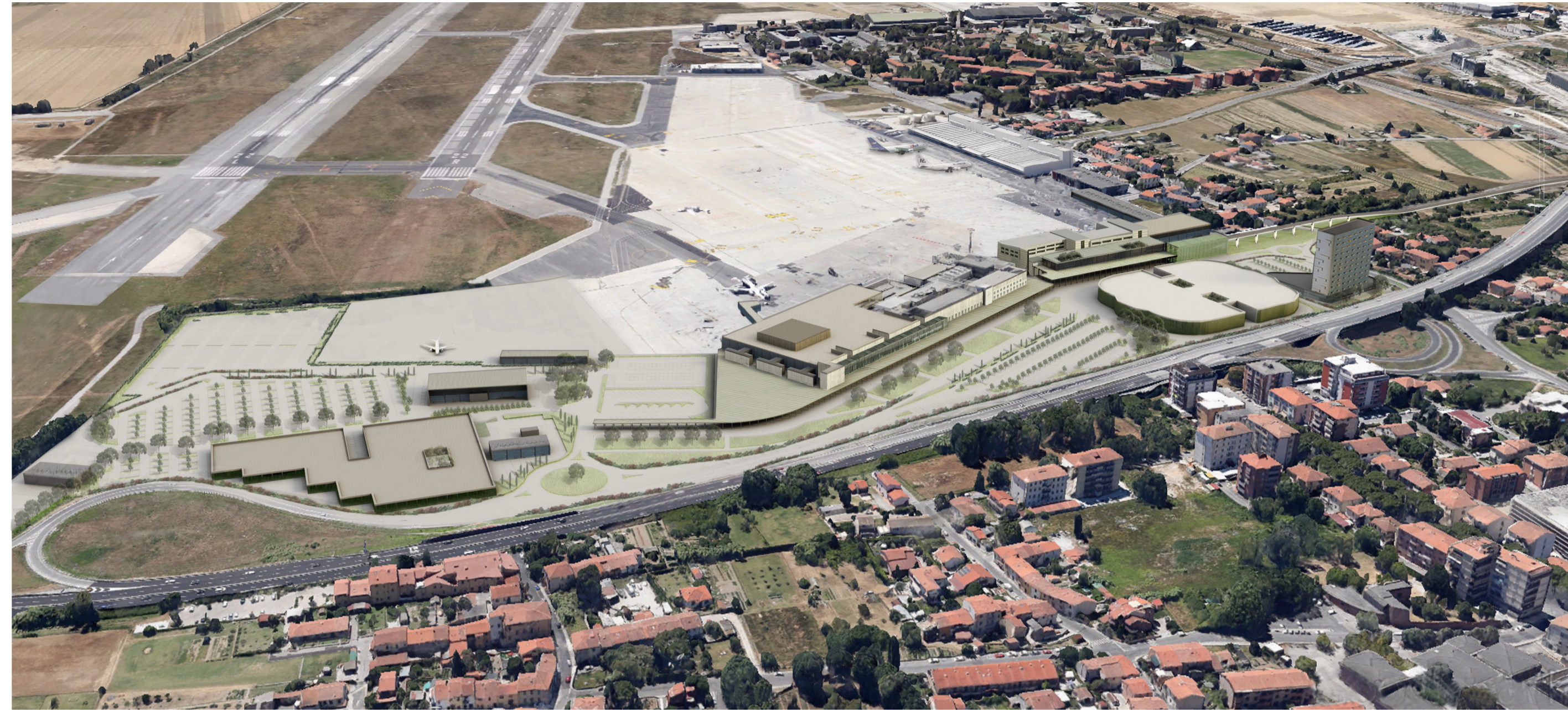
Fotoinserimento Territoriale dell'intervento