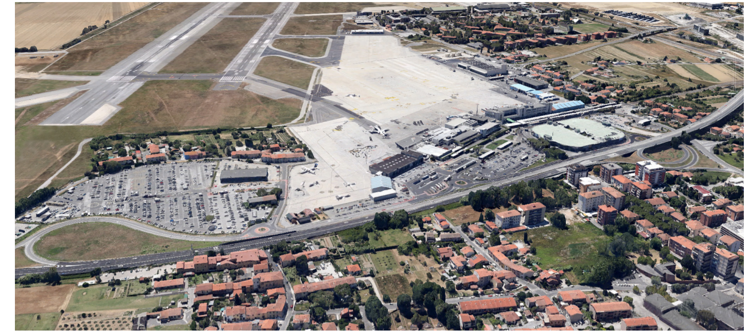
Immagine dello stato di fatto