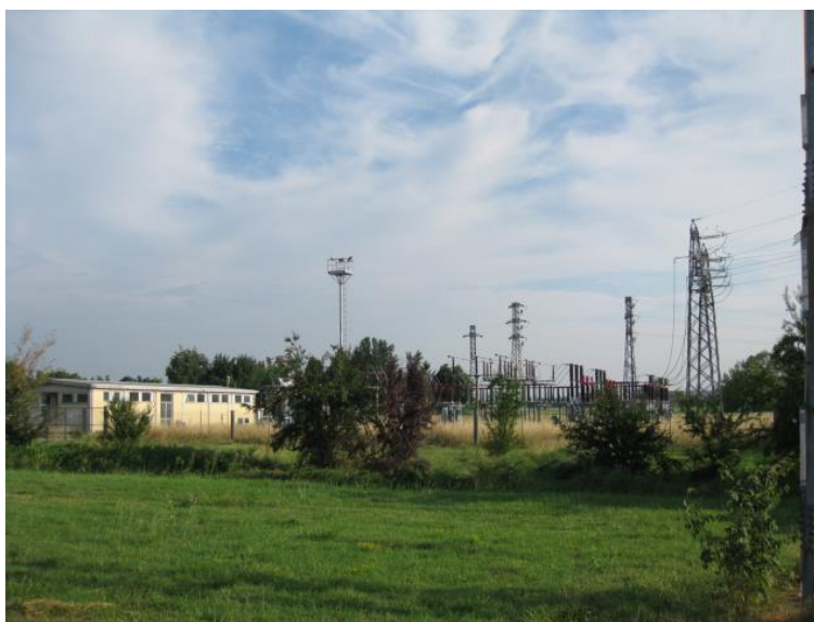
Foto 14 - Stazione elettrica di Castelnovo di Sotto