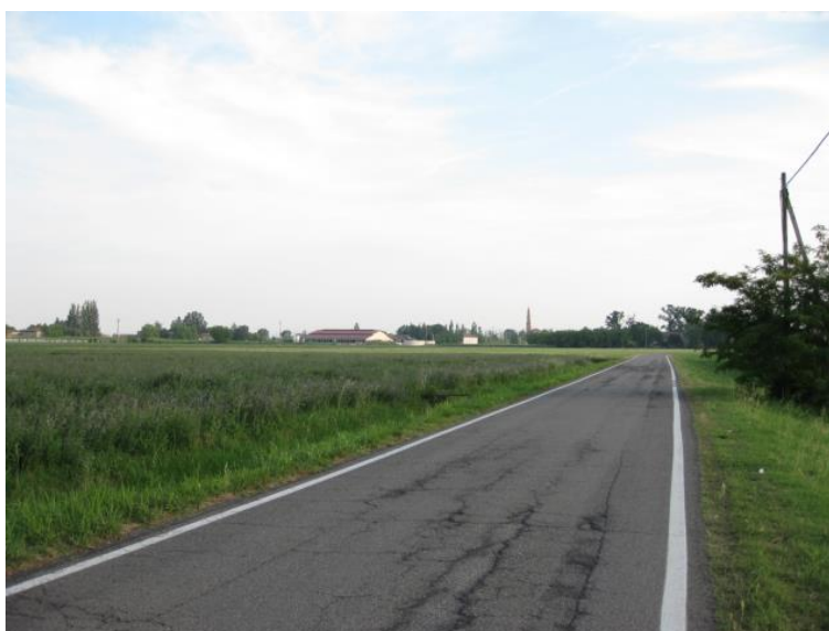
Foto 25 - Dalla strada di accesso a Castello di Vialato