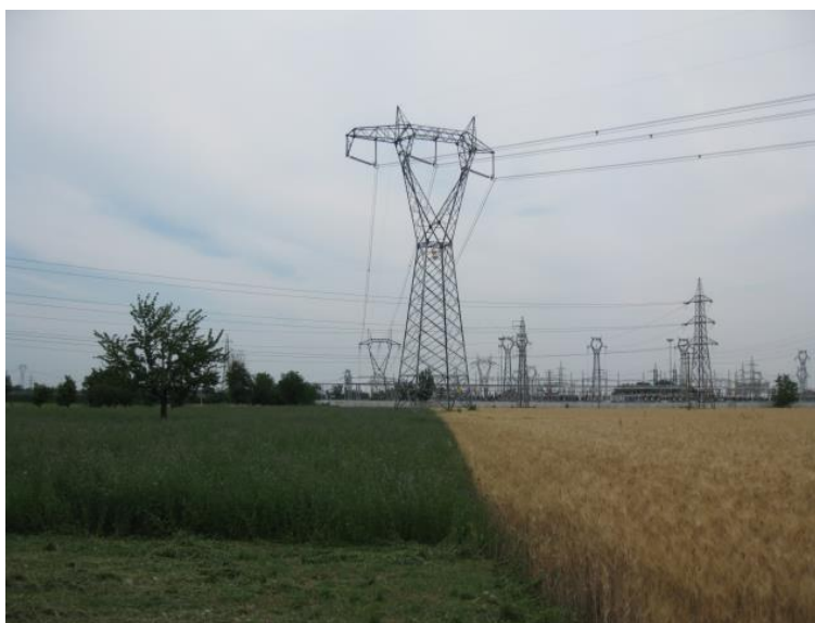
Foto 40 - Stazione elettrica di Rubiera