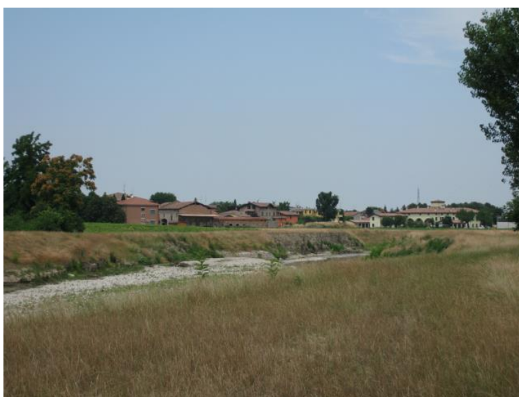
Foto 38 - Torrente Tresinaro dal ponte nei pressi di Due Maestà