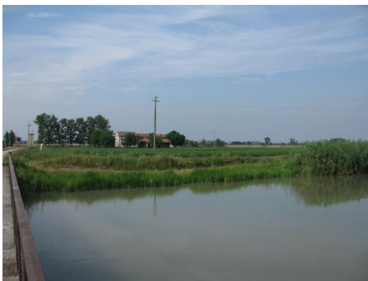
Foto 12 - Canale derivatore a Nord-Est di Terramara di Santa Rosa