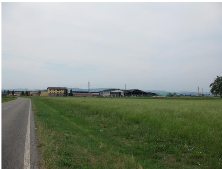
Foto 39 - Dall'abitato di Marmirolo verso l'elettrodotto