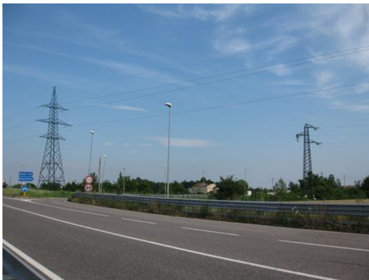
Foto 2 – strada Cispadana a Nord della Cabina primaria di Boretto