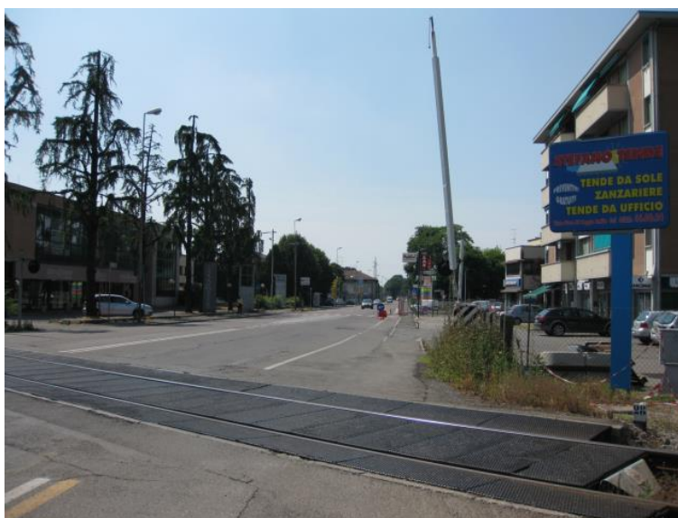
Foto 28 - Via Emilia - Reggio Emilia