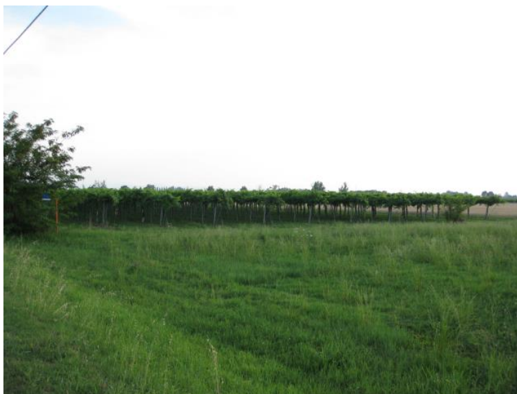
Foto 29 - Campagna intorno a Reggio Emilia