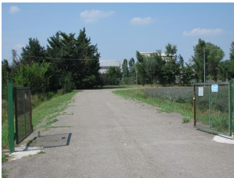
Foto 17 - Ingresso al Lago ex Mattonaia