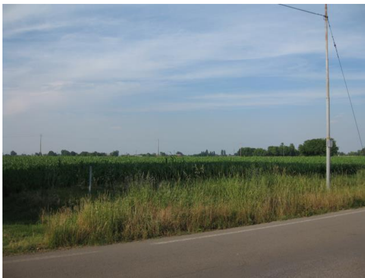
Foto 13 - Dall'abitato di Poviglio verso l'elettrodotto