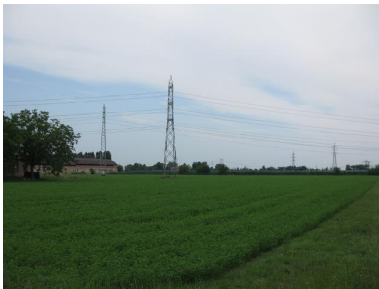
Foto 41 - Nei pressi della Stazione elettrica di Rubiera