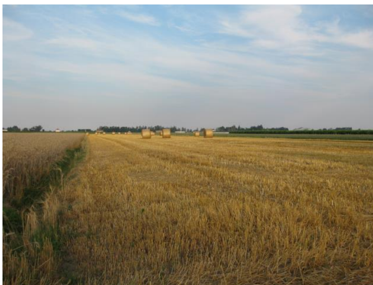
Foto 18 - Paesaggio nei pressi di Corte del Traghetino