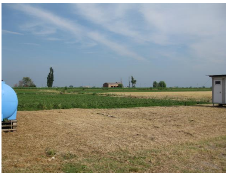
Foto 10 - Paesaggio nei pressi di Cascina Santa Rosa