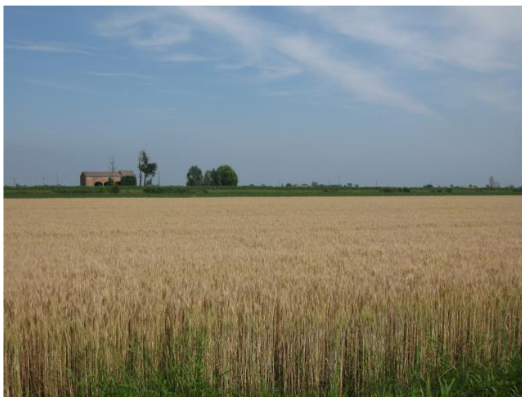
Foto 9 - Paesaggio nei pressi di Cascina Santa Rosa