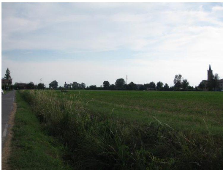
Foto 7 - Dal centro abitato di Fodico verso l'elettrodotto