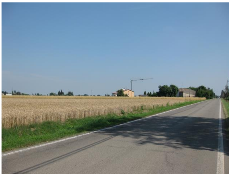
Foto 5 - Dalla Strada Provinciale n. 1, in direzione Sud