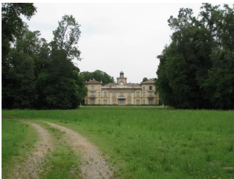
Foto 30 - Facciata principale di Villa Spalletti