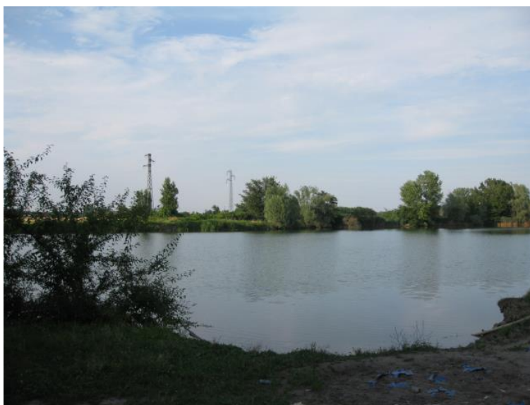
Foto 16 - Dal Lago ex Mattonaia, verso l'elettrodotto