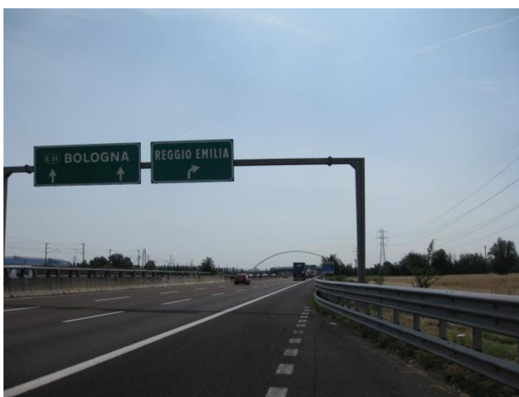
Foto 26 - Dall'Autostrada A1 verso i ponti di Calatrava