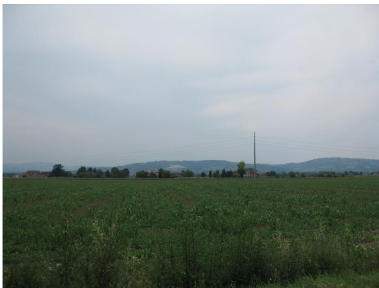
Foto 33 - Campagna nei dintorni d Casalgrande