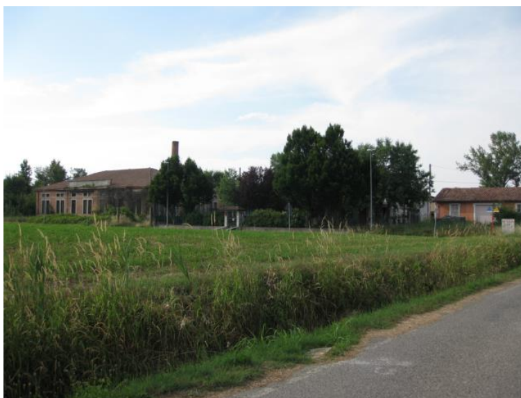
Foto 6 - Centro abitato di Fodico