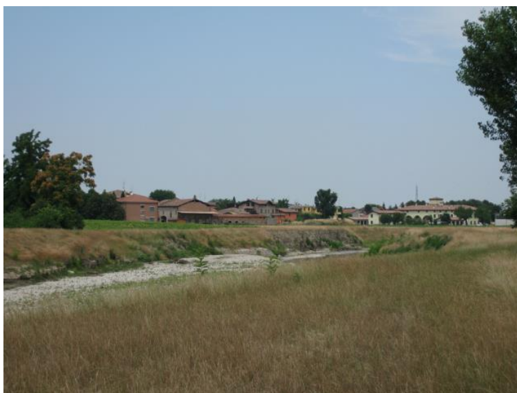
Foto 38 - Torrente Tresinaro dal ponte nei pressi di Due Maestà