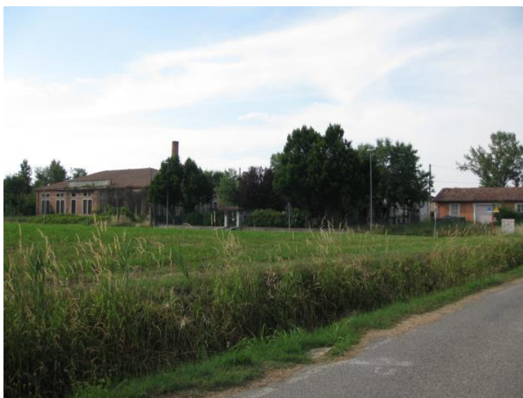
Foto 6 - Centro abitato di Fodico