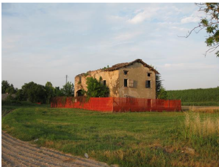
Foto 20 - Rudere nella Corte del Traghetto