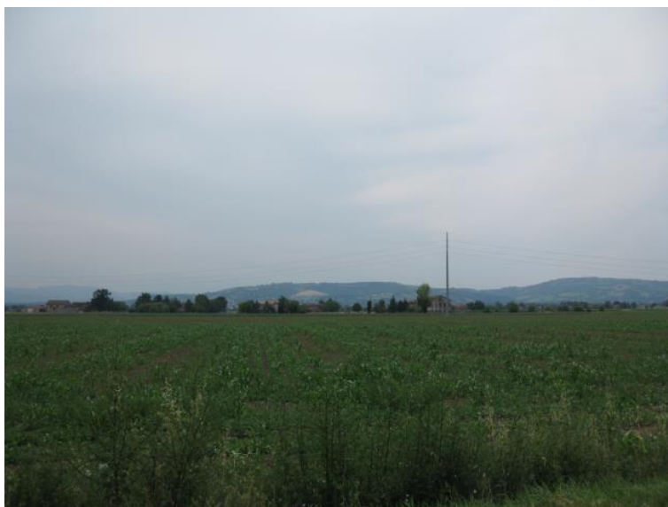
Foto 33 - Campagna nei dintorni d Casalgrande