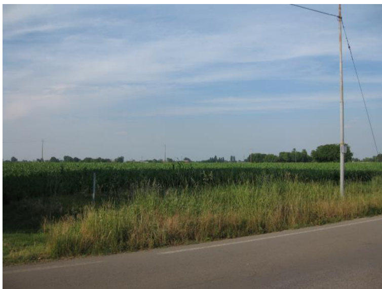
Foto 13 - Dall'abitato di Poviglio verso l'elettrodotto