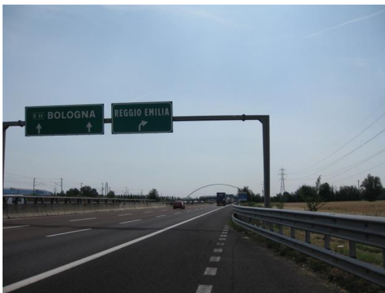
Foto 26 - Dall'Autostrada A1 verso i ponti di Calatrava