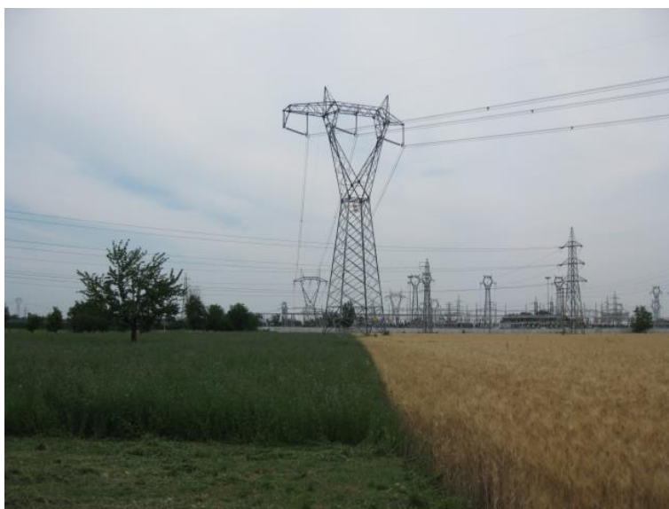
Foto 40 - Stazione elettrica di Rubiera