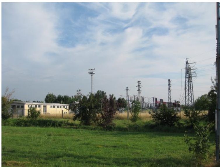
Foto 14 - Stazione elettrica di Castelnovo di Sotto