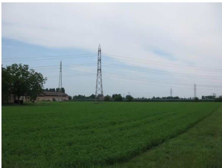
Foto 41 - Nei pressi della Stazione elettrica di Rubiera