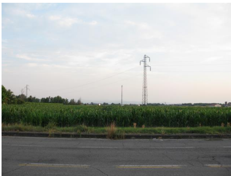
Foto 24 - Dall'abitato di Cadelbosco di Sopra, verso l'elettodotto in demolizione