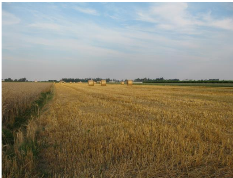
Foto 18 - Paesaggio nei pressi di Corte del Traghetino