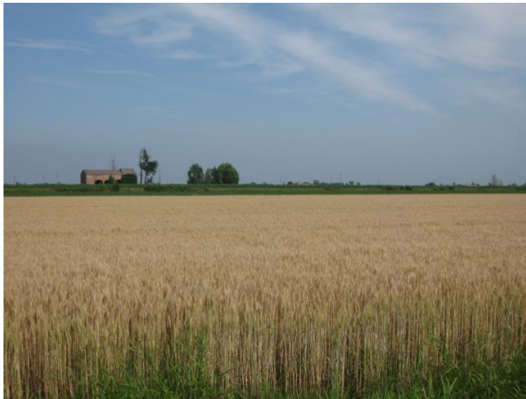
Foto 9 - Paesaggio nei pressi di Cascina Santa Rosa