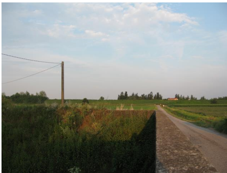
Foto 23 - Vista verso il SIC Fontanili di Corte Valle Re