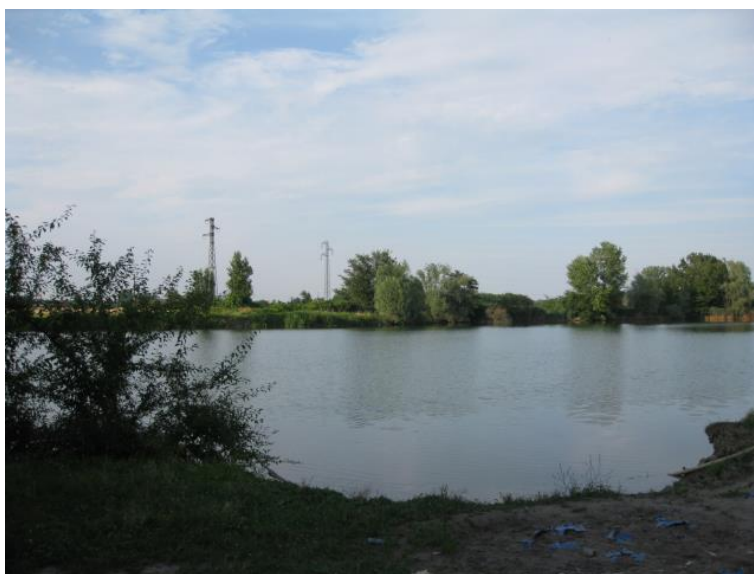
Foto 16 - Dal Lago ex Mattonaia, verso l'elettrodotto