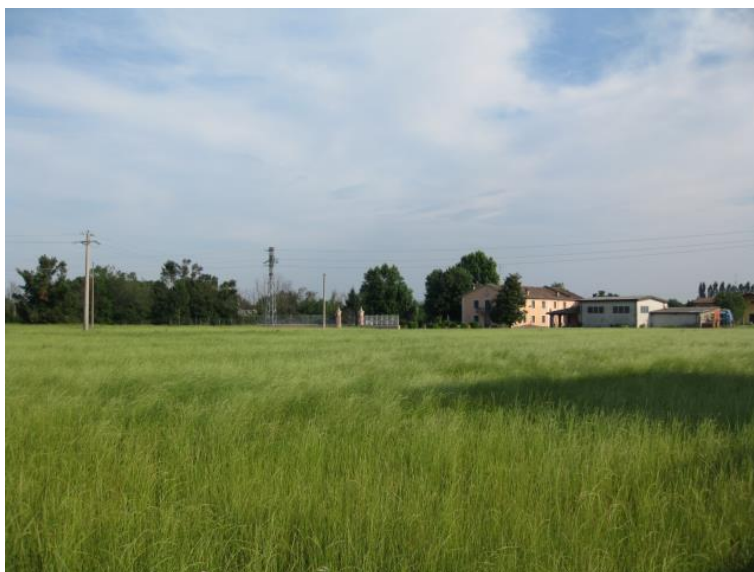
Foto 15 - Dal fronte abitato di Castelnuovo di Sotto verso l'elettrodotto