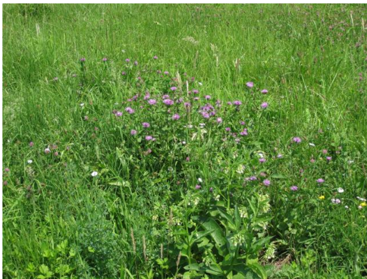
Foto 34 - Vegetazione nel SIC n. IT4030021 "Rio Rodano e Fontanili di Fogliano e Ariolo"