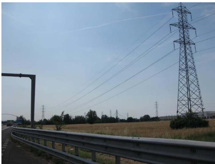
Foto 27 - Dall'Autostrada A1 verso l'elettrodotto in demolizione