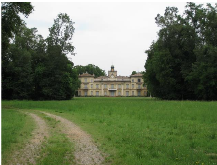
Foto 30 - Facciata principale di Villa Spalletti