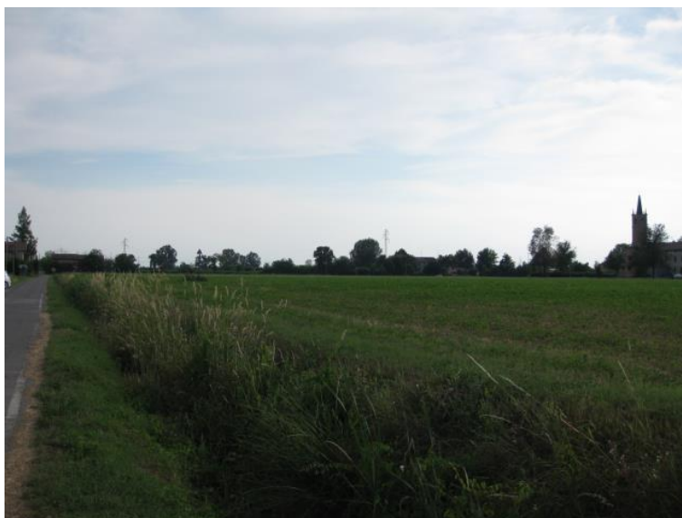
Foto 7 - Dal centro abitato di Fodico verso l'elettrodotto