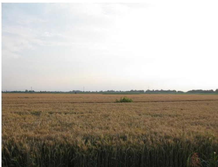
Foto 22 - Vista da Corte del Traghetino, verso l'elettrodotto esistente