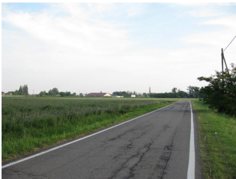
Foto 25 - Dalla strada di accesso a Castello di Vialato