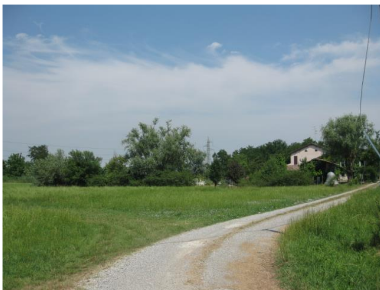
Foto 36 - Strada poderale nel SIC n. IT4030021 "Rio Rodano e Fontanili di Fogliano e Ariolo"