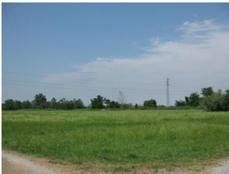
Foto 35 - Strada poderale nel SIC n. IT4030021 "Rio Rodano e Fontanili di Fogliano e Ariolo"