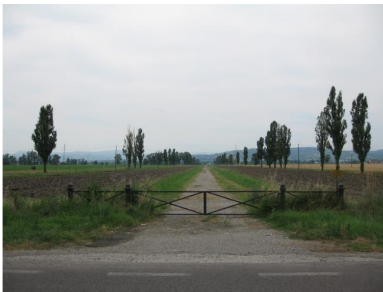
Foto 31 - Da Villa Spalletti, verso il filare alberato