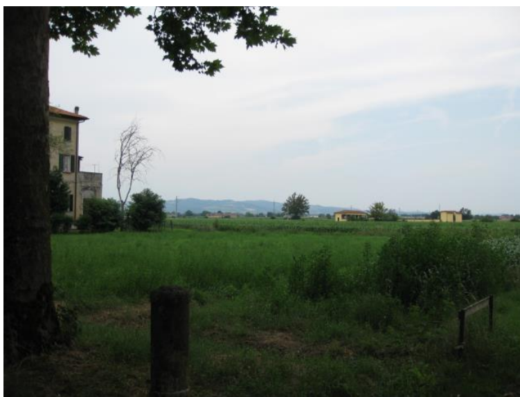
Foto 32 - Dall'ingresso principale di Villa Spalletti, verso l'elettrodotto