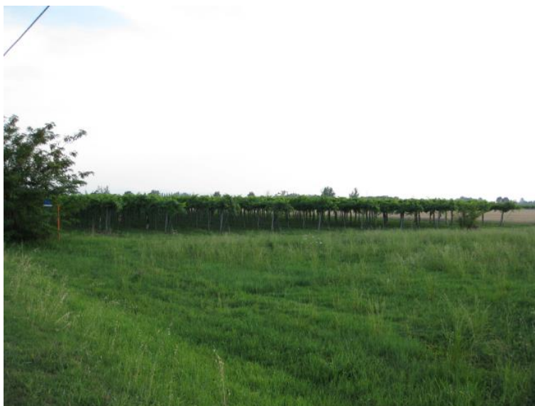
Foto 29 - Campagna intorno a Reggio Emilia