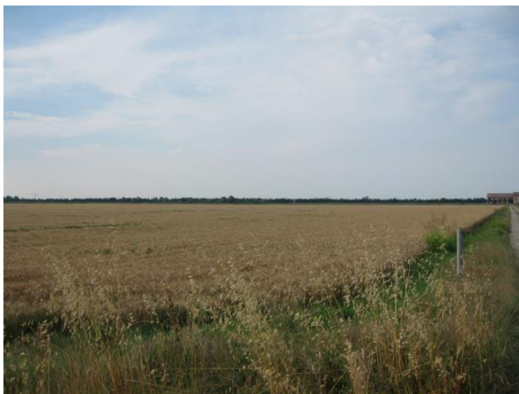
Foto 11 - Paesaggio nei pressi della strada di accesso a Cascina Santa Rosa