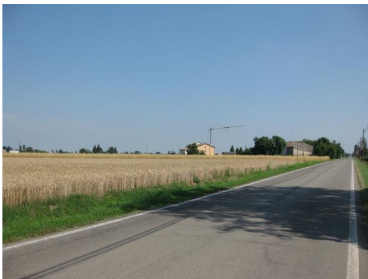
Foto 5 - Dalla Strada Provinciale n. 1, in direzione Sud