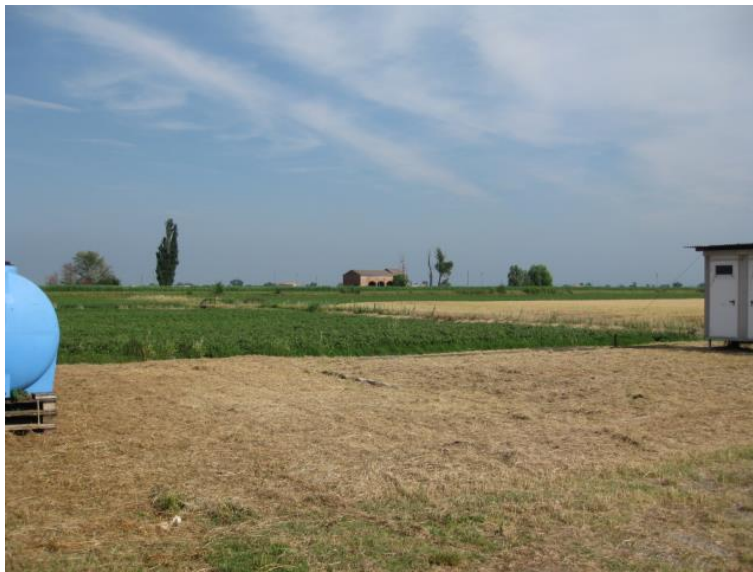
Foto 10 - Paesaggio nei pressi di Cascina Santa Rosa