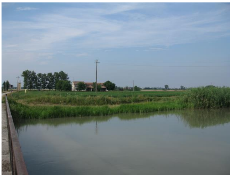
Foto 12 - Canale derivatore a Nord-Est di Terramara di Santa Rosa