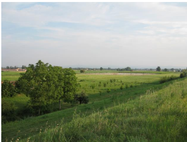
Foto 19 - Paesaggio dall'argine a Sud – Est di Corte del Traghetto