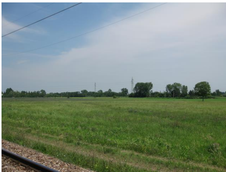
Foto 37 - Dalla Stazione ferroviaria Due Maestà nel SIC n. IT4030021 "Rio Rodano e Fontanili di Fogliano e Ariolo"