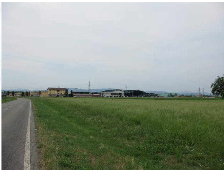
Foto 39 - Dall'abitato di Marmiolo verso l'elettrodotto