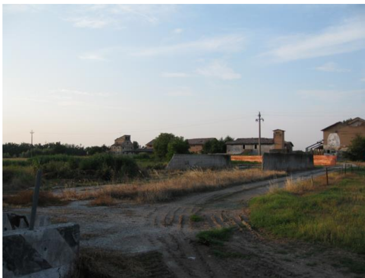
Foto 21 - Corte del Traghetino