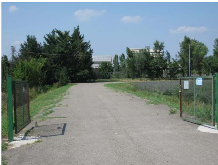
Foto 17 - Ingresso al Lago ex Mattonaia