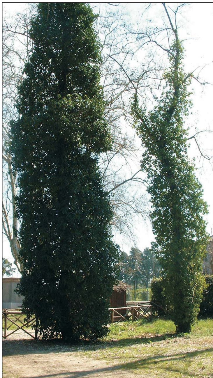
Foto 14 - Lecci a fianco dell'idrovora