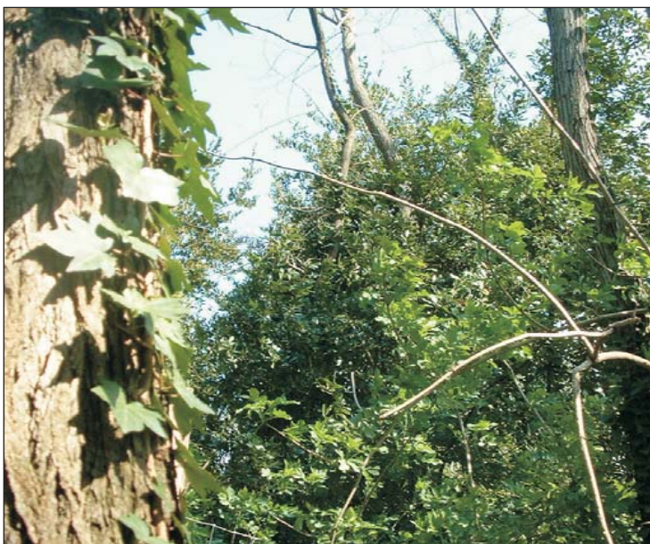
Foto 13 - Acacie con edera