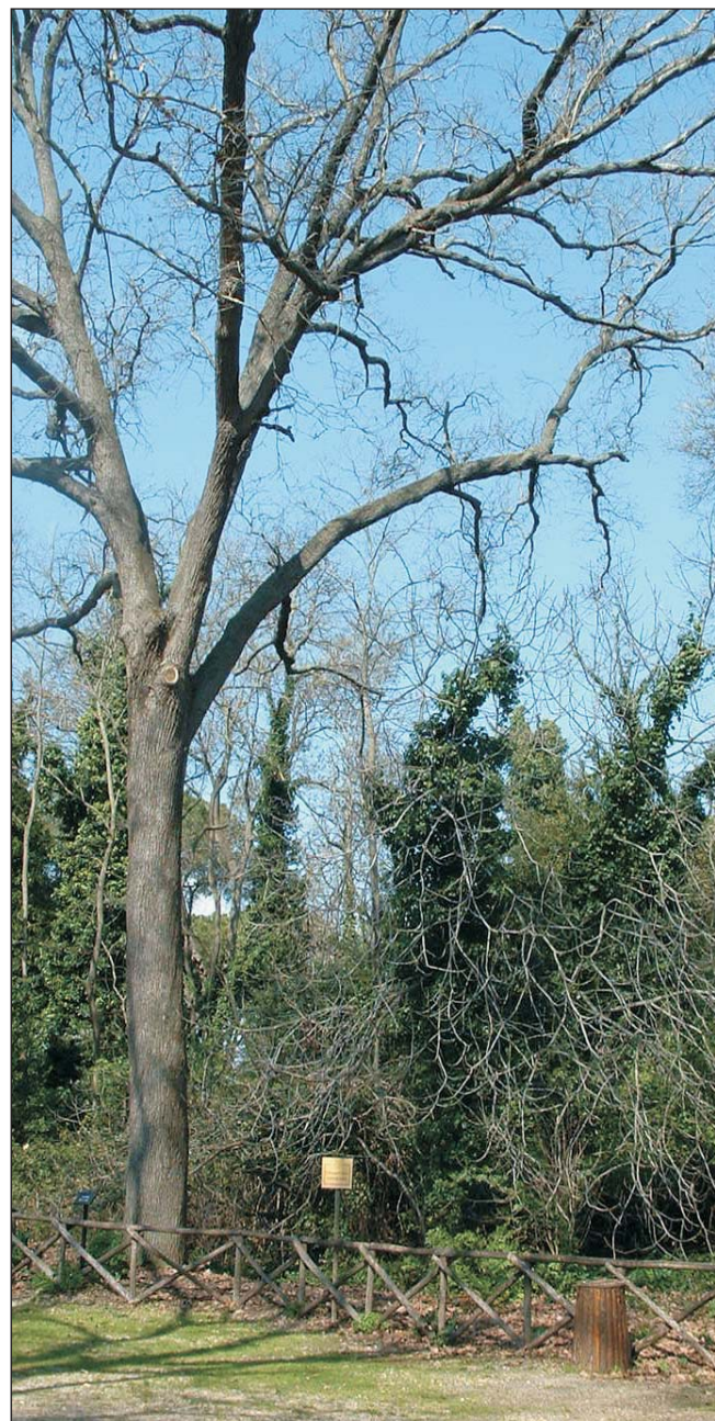
Foto 12 - Bosco igrofilo con sottobosco fitto