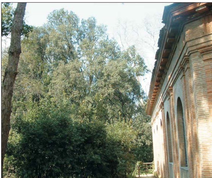
Foto 15 - Vista del lago