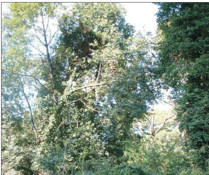
Foto 11 - Farnia di notevole pregio naturalistico