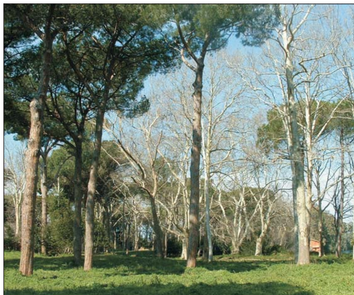
Foto 10 - Bosco igrofilo con sottobosco fitto