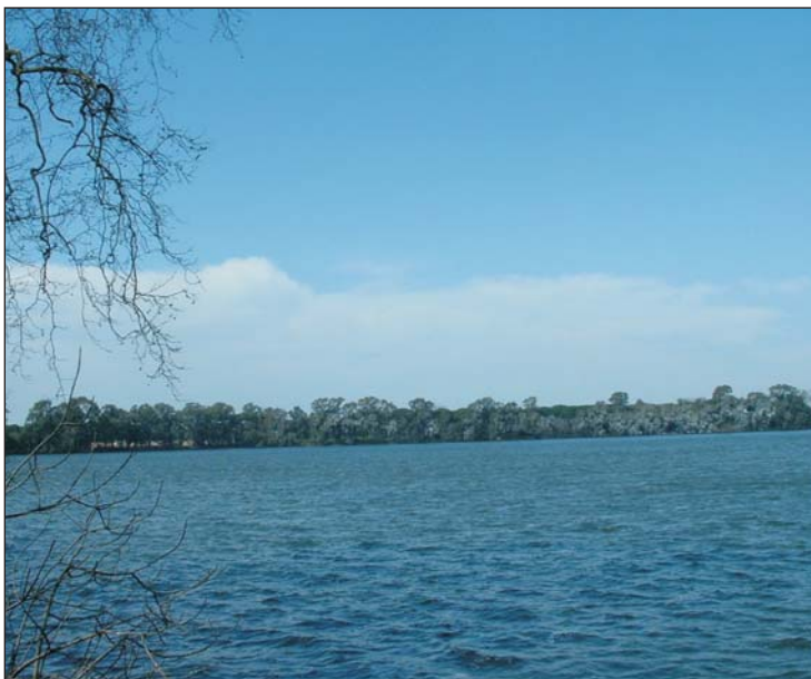
Foto 16 - Platani e pini domestici