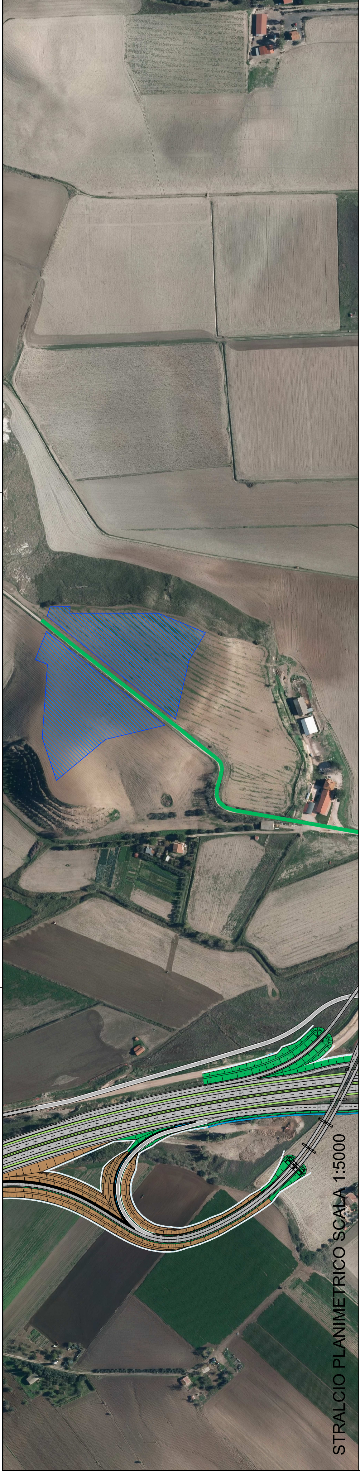
STRALCIO PLANIMETRICO SCALA 1:5000