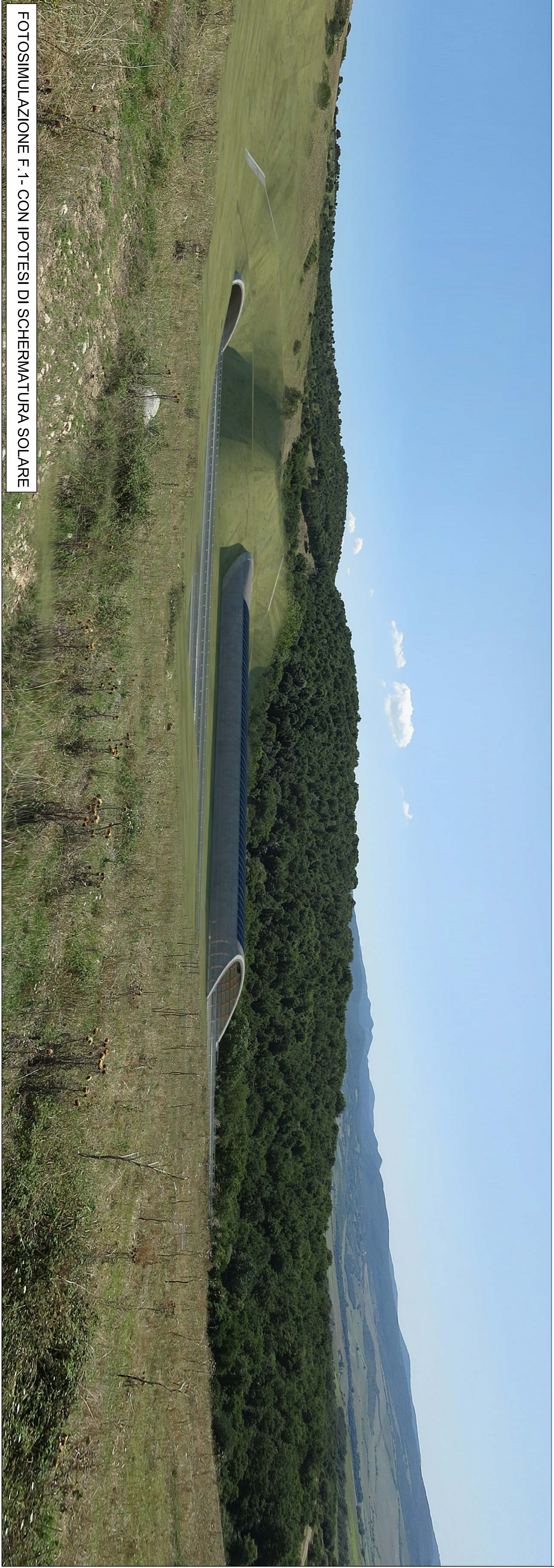
FOTOSIMULAZIONE F.1 - CON IPOTESI DI SCHERMATURA SOLARE