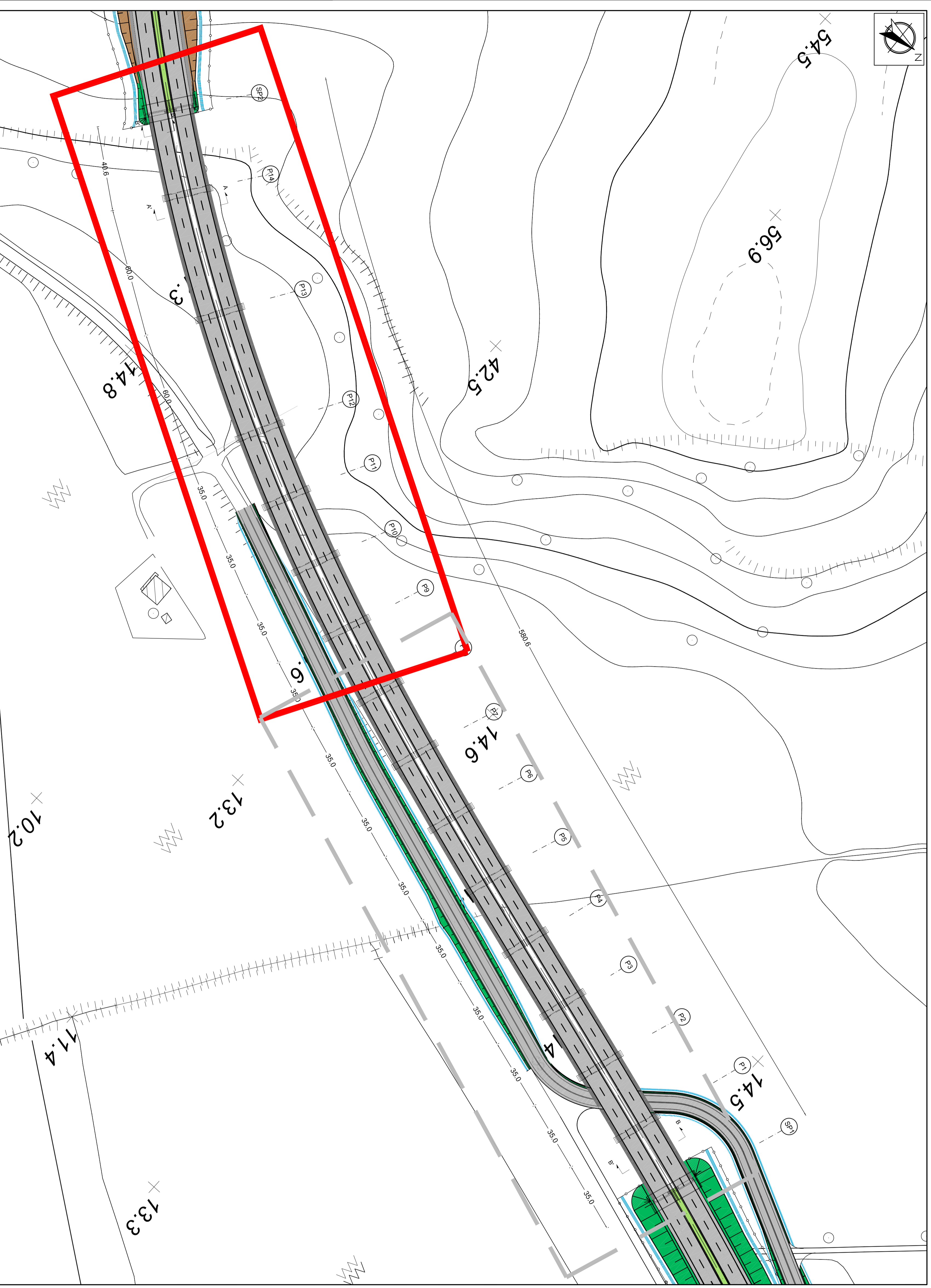
PIANTA SCALA 1:1000