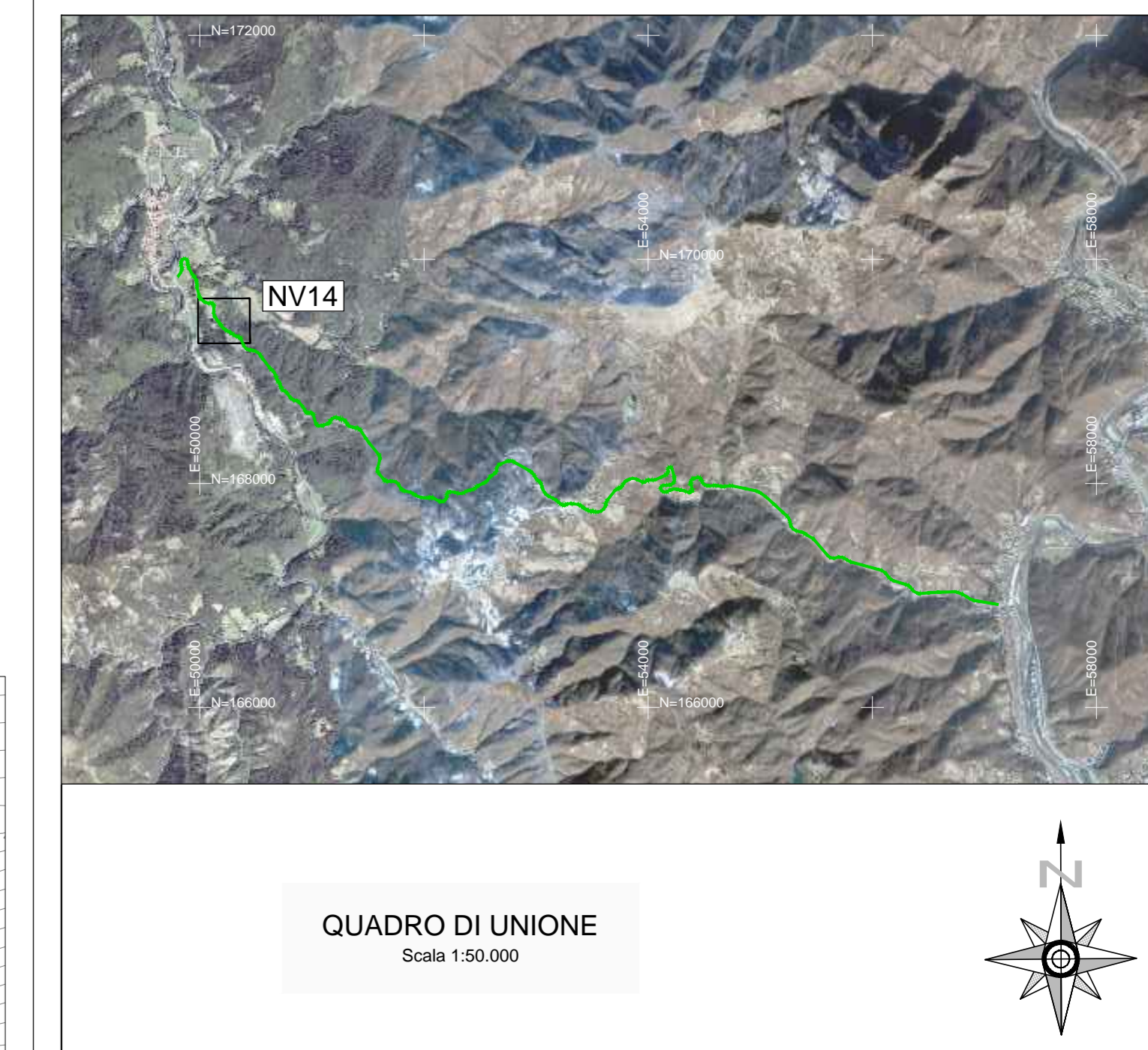
QUADRO DI UNIONE Scala 1:50.000