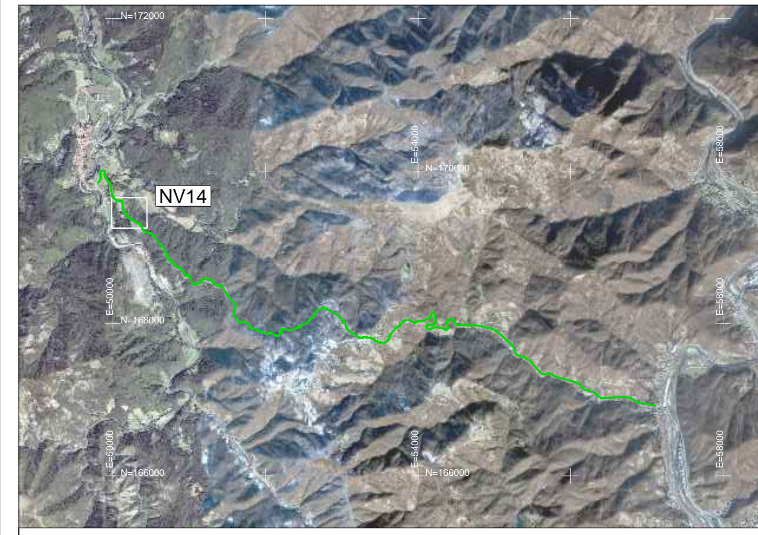
QUADRO DI UNIONE Scala 1:50.000