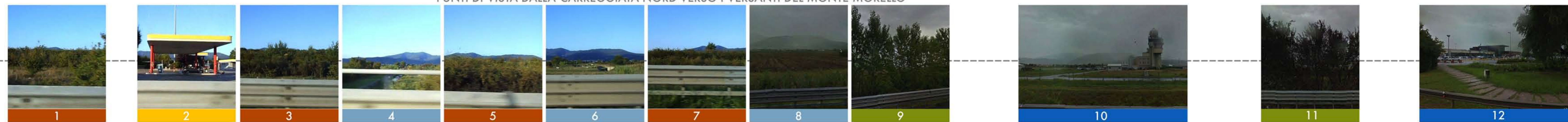
PUNTI DI VISTA DALLA CARREGGIATA NORD VERSO I VERSANTI DEL MONTE MORELLO