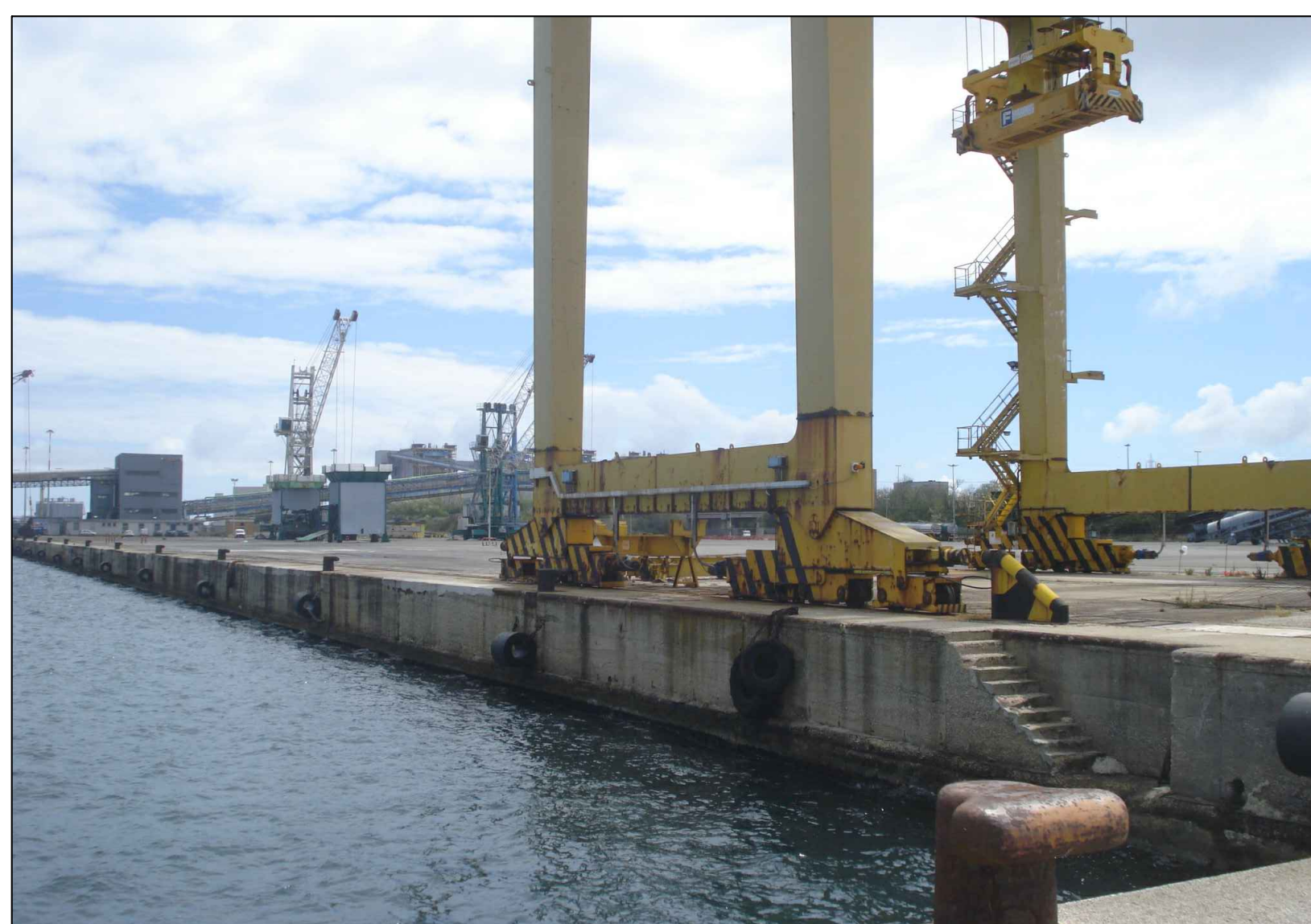
Particolare molo di Costa Morena