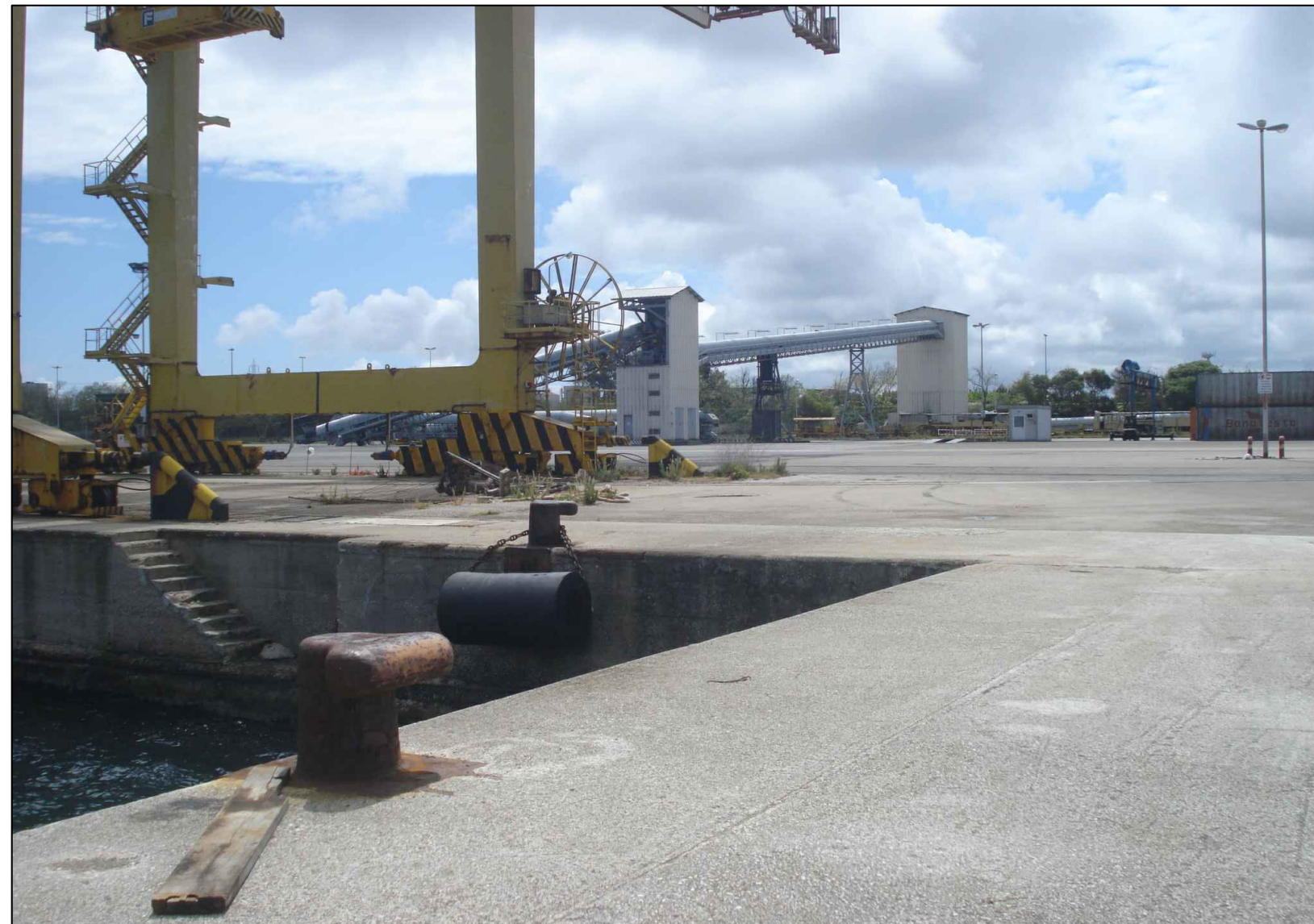
Particolare molo di Costa Morena