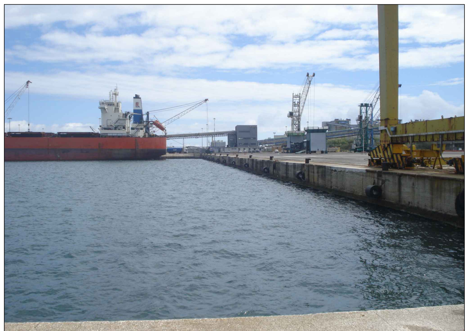
Particolare molo di Costa Morena