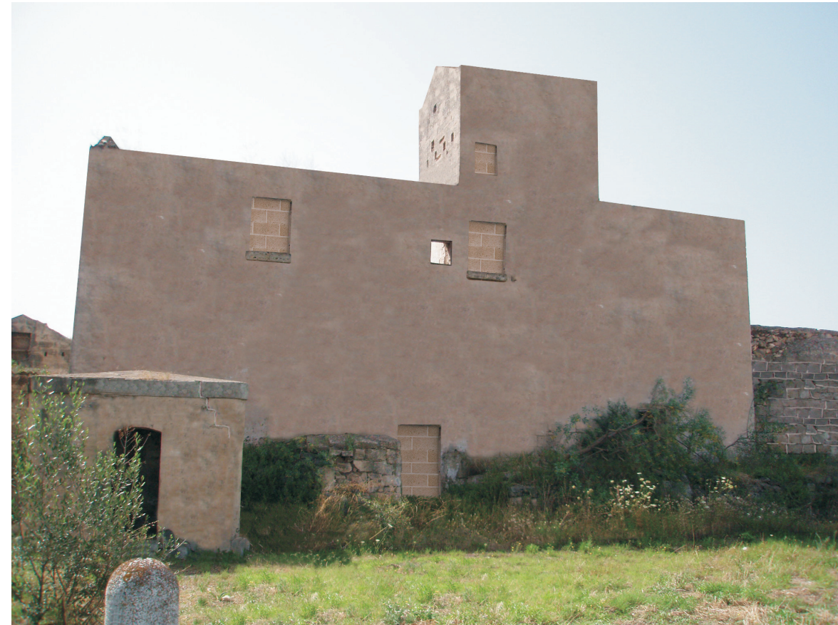
Rendering fotorealistico degli effetti prodotti dagli interventi