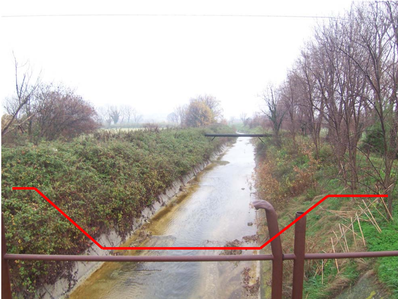
SEZIONE SCHEMATICA DELL'ATTRAVERSAMENTO