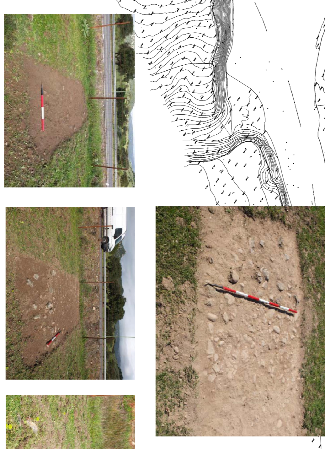
AREA SAN MARCO