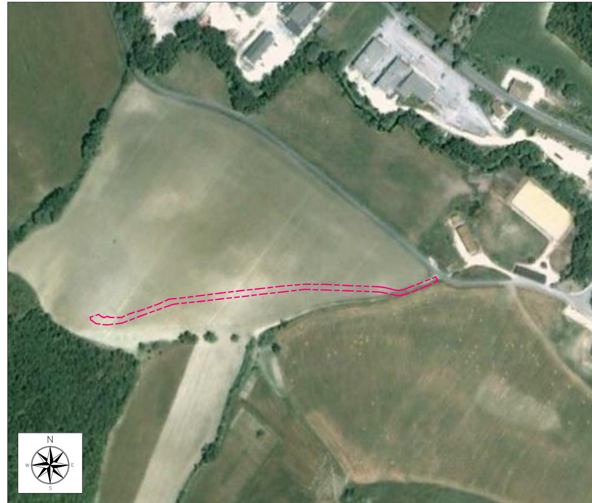
ORTOFOTO DI INQUADRAMENTO - SCALA 1:2000