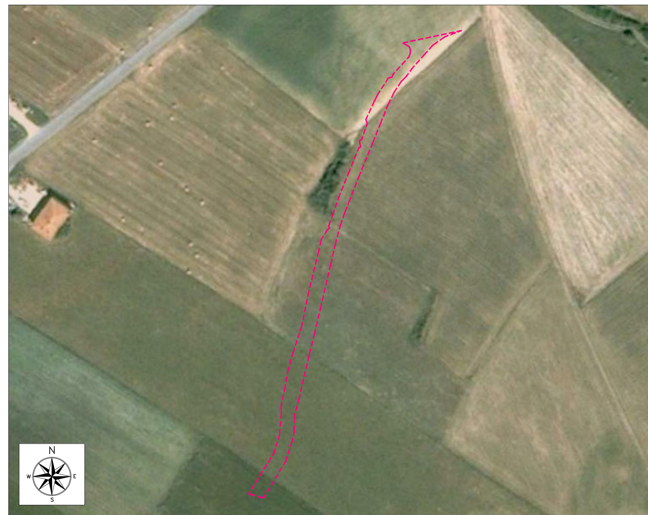
ORTOFOTO DI INQUADRAMENTO - SCALA 1:1000