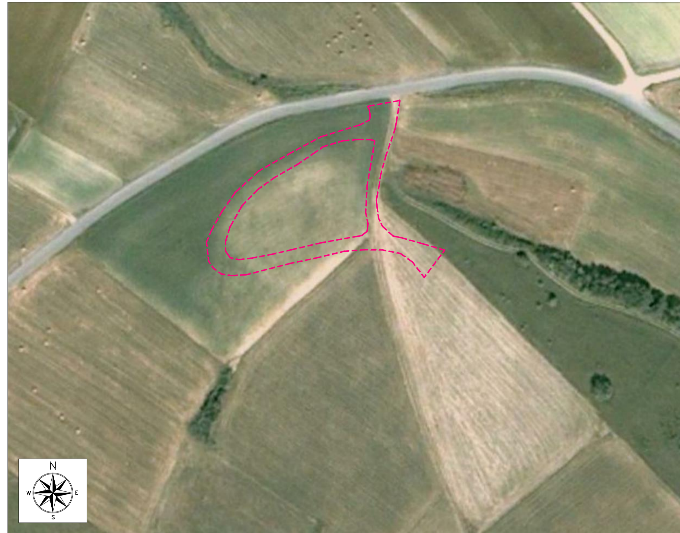
ORTOFOTO DI INQUADRAMENTO - SCALA 1:1000