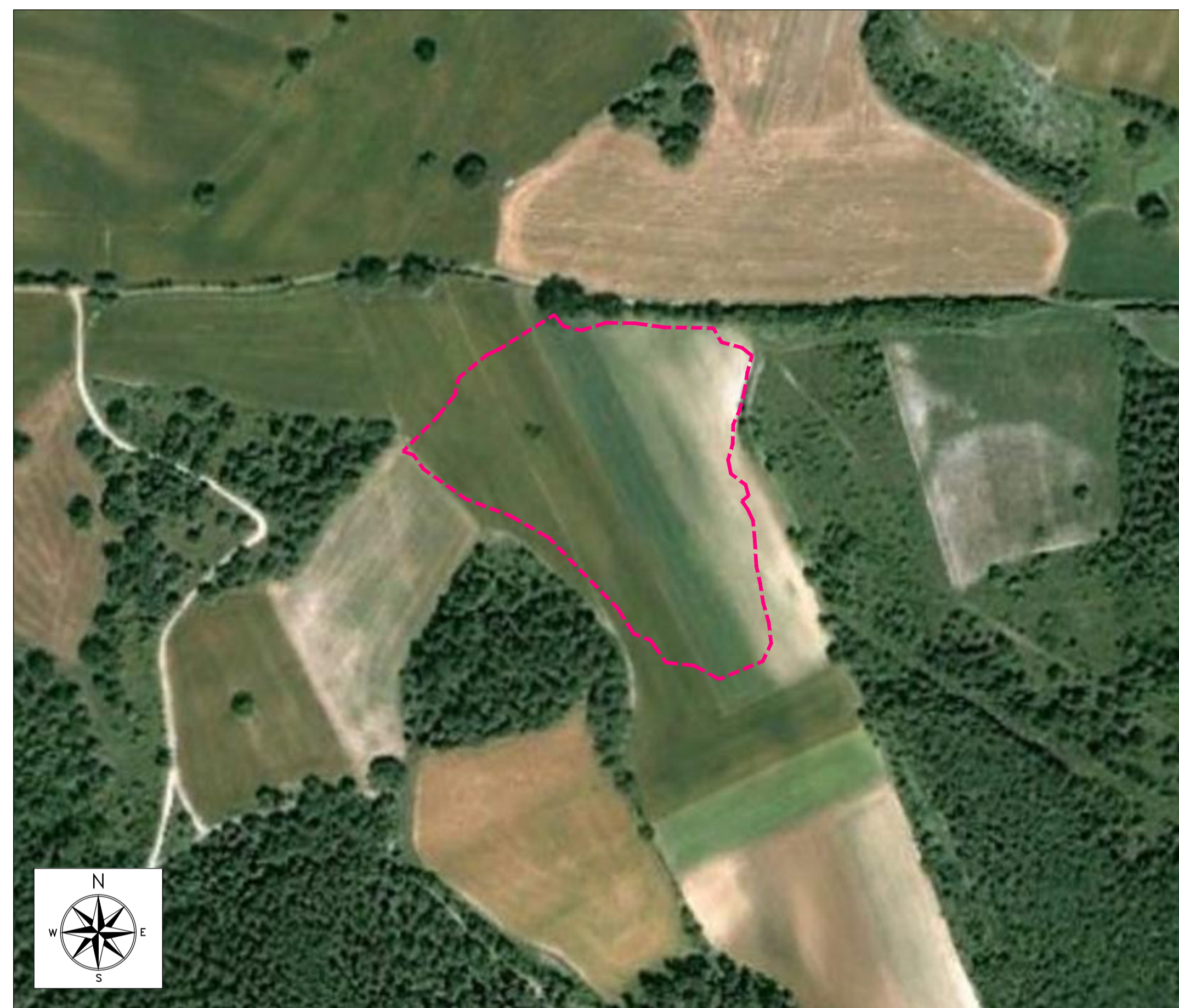
ORTOFOTO DI INQUADRAMENTO - SCALA 1:2000