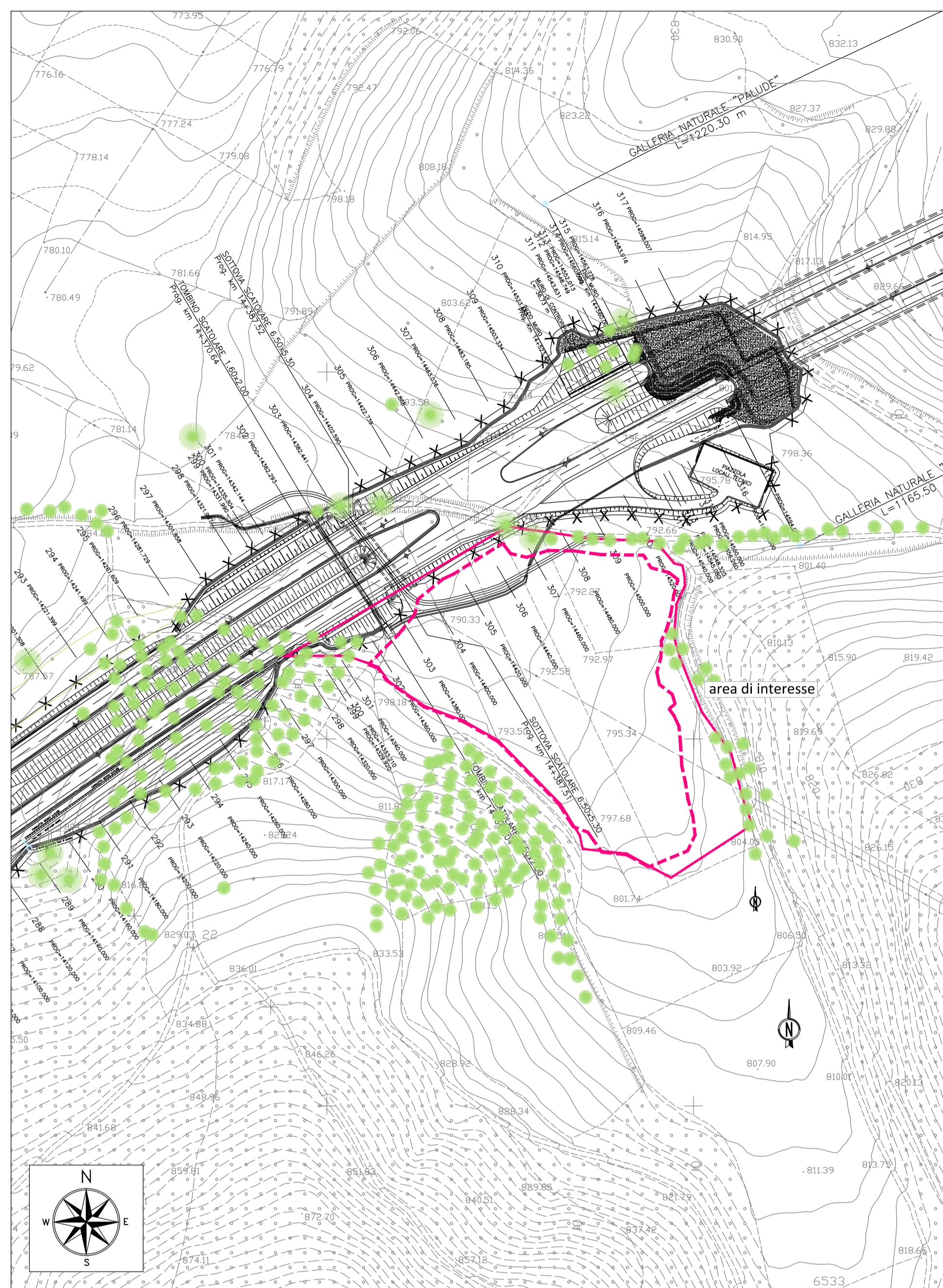
PLANIMETRIA DI INQUADRAMENTO - SCALA 1:2000